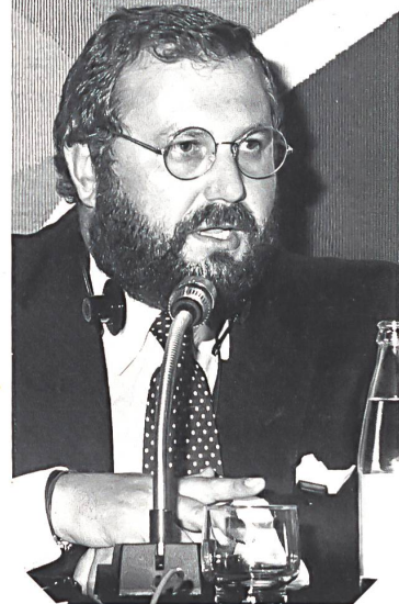
Gianfranco Ferré , Créateur, Mailand