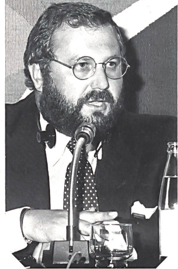
Gianfranco Ferré , Créateur, Mailand