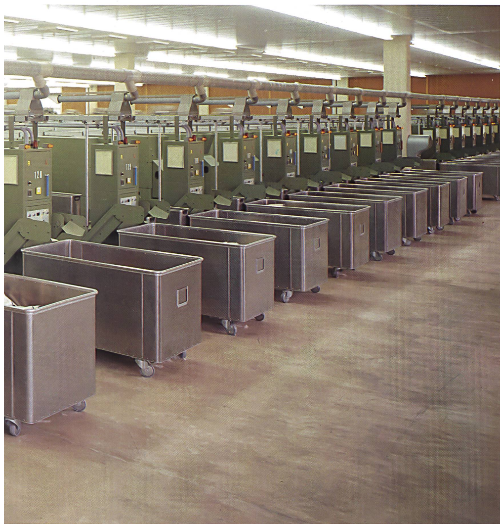
The huge room with fully automated ring-spinning frames is one of the most up-to-date plants in existence.