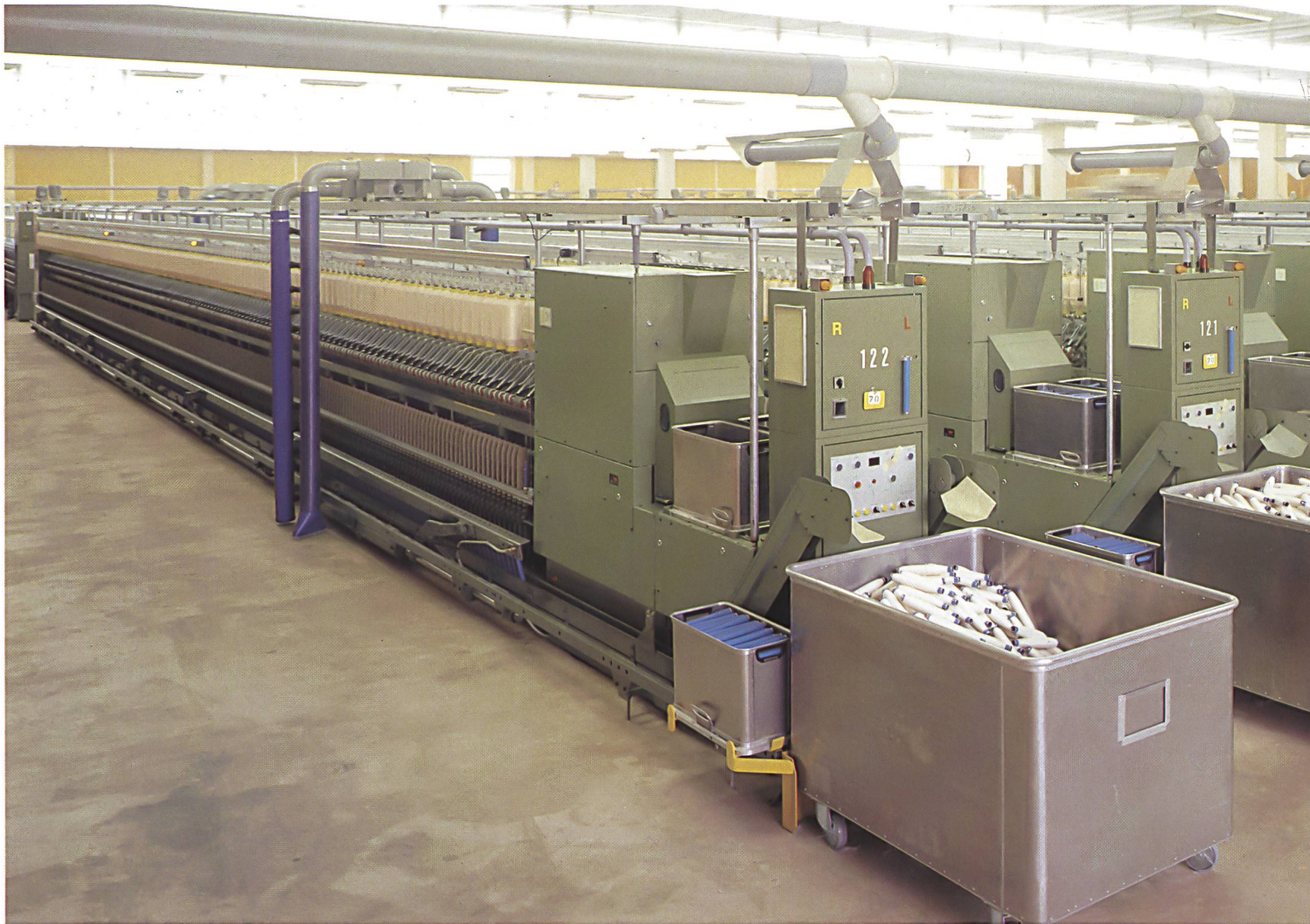
Der riesige Saal mit den vollautomatischen Ringspinnmaschinen ist eine der modernsten Anlagen, die heute existieren.

Im 1981 erstellten Lagerhaus ist ein Vorrat von 2500 t extralangstapiger Baumwolle untergebracht. Um das Brandrisiko zu limitieren, ist der Kubus des Baues in vier völlig getrennte Kammern unterteilt, die mit neusten Feuermeldeanlagen ausgerüstet sind. Besonders konzipierte Lichtkuppeln würden bei einem Brandausbruch dafür sorgen, dass die entstehenden