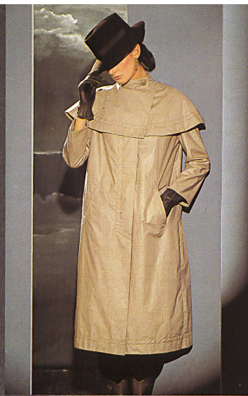
«Tornado», daunendichtes Feingewebe mit spezieller Ausrüstung / tissé fin extrêmement serré à finissage spécial / fine down-proof fabric with a special finish.