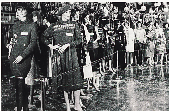
Die «Mode-Linie» im Foyer des TMC fand interessierte Beachtung.

werden, dass die gesteckten Ziele 1980 erreicht worden sind, dass die Jahresrechnung auch nach Abschreibungen und Rückstellungen einen Reingewinn von zirka Fr. 50000.- aufweist, und dies bei einer Eigenfinanzierung der Genossenschaft von 95,2%. Alle der normalen Fluktuation in einem Unternehmen dieser Grösse entsprechenden Vakanz konnten sogleich neu besetzt werden. Auch die Infrastrukturbetriebe machen erfreuliche Umsätze, so dass die Deckungsbeiträge gekürzt werden können. Die steigende Kundenfrequenz ist ein weiteres Positivum des Jahres 1980. Anlass zu Kritik gibt aber nach wie vor die vielenorts allzu spärliche Besetzung der Showräume, da wünscht man sich eine baldige Änderung. Umfangreichstes Traktandum war dann die Diskussion um die Erweiterungsetappe TMC, die ja im Herbst 1981 weitgehend fertiggestellt sein wird. Den diesbezüglichen Anträgen des Verwaltungsrates wurde mit grosser Mehrheit stattgegeben, wobei diese vor allem rechtliche Regelungen und die Globalmietverträge betrafen. Die Struktur und die Besonderheiten des Erweiterungsbaus selbst, wurden der Versammlung in kompetenter und knapper Art von Theodor Spaltenstein erläutert.