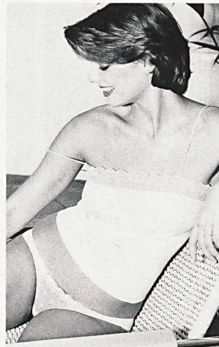
Jugendliche Garnitur in reiner Seide mit St. Galler Tüllspitze aus der neuen Trend-Serie «Hanro Viva». (Hanro AG, Liestal)

Drei modische Richtlinien haben sich hier in den Vordergrund geschoben. Ein deutlicher Trend zu sophistischer, eleganter Wäsche mit reicher Stoff-Fülle und verschwenderischen Spitzenapplikationen und Inkrustationen. Dann eine verspielte Romantik «à la grand-mère» mit Rüschen, Bändern und fantasievollen Verzierungen. Im sportlichen Genre sind es vor allem Homewear-Artikel, die sehr gefragt sind. Mäntel, Jacken und Westen sind wichtige Ergänzungen und oft lässt sich zwischen Tages- und Nachtwäsche nicht mal mehr unterscheiden. Auf jeden Fall muss der Einsatzbereich bei den heutigen Lingerie-Modellen unbedingt vielseitig sein.