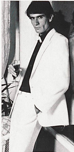
Party-Anzug mit Spitzrevers aus shantungartigem Leichtgewebe. (Modell Ritex AG, Zofingen)