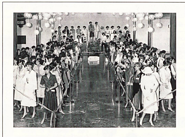
Der «Puppenwald» in der Eingangshalle des TMC: einer der Höhepunkte der MODETAGE ZÜRICH.

Innerhalb von sehr kurzer Zeit gelang es den Initianten dieser Modetage denn auch, das Projekt zu lancieren, die davon Betroffenen entsprechend zu interessieren und zu motivieren und das Ganze konkret zu präsentieren. Schon allein der «konzentrierte» Kleiderpuppenwald im Foyer des TMC spricht für sich. Alle Beteiligten haben sich zu einer gemeinsamen Aktion, ohne kleinliches Konkurrenzdenken, entschlossen, was auf lange Sicht für die inländische Textil- und Konfektionsindustrie überzeugendste Erfolgchancen versprechen dürfte.