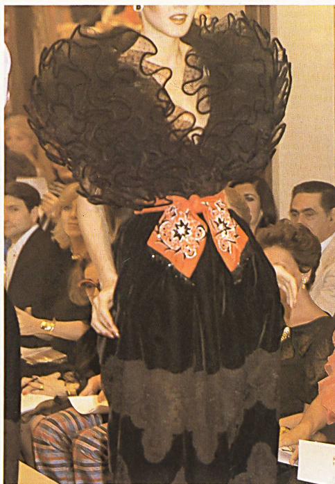
Galon de tulle de coton brodé, incrusté sur la jupe / Bestickter Baumwolltüll-Galon, im Jupe inkrustiert / Embroidered cotton tulle braid insertion on the skirt.

V alentino, maître de l' «alta moda», est le chef de file incontesté de la couture italienne. Il possède une immense expérience dans le domaine de la mode et un sens affiné pour les belles matières et les effets de couleurs qui plaisent. Ses ambitions sur le plan esthétique, soutenues par une science infailible de la coupe, lui permettent d'approcher le sommet absolu de la perfection. Il n'est donc pas étonnant qu'il choisisse, pour ses créations, des broderies dont la facture n'est guère moins admirable que celle des travaux à l'aiguille du temps passé. Pour lui, Forster Willi + Cie SA à St-Gall a créé de précieuses guipures et broderies découpées de genre traditionnel, ainsi que des classiques broderies sur tulle, dont la vigueur expressive est capable d'enthousiasmer les vrais connaisseurs.