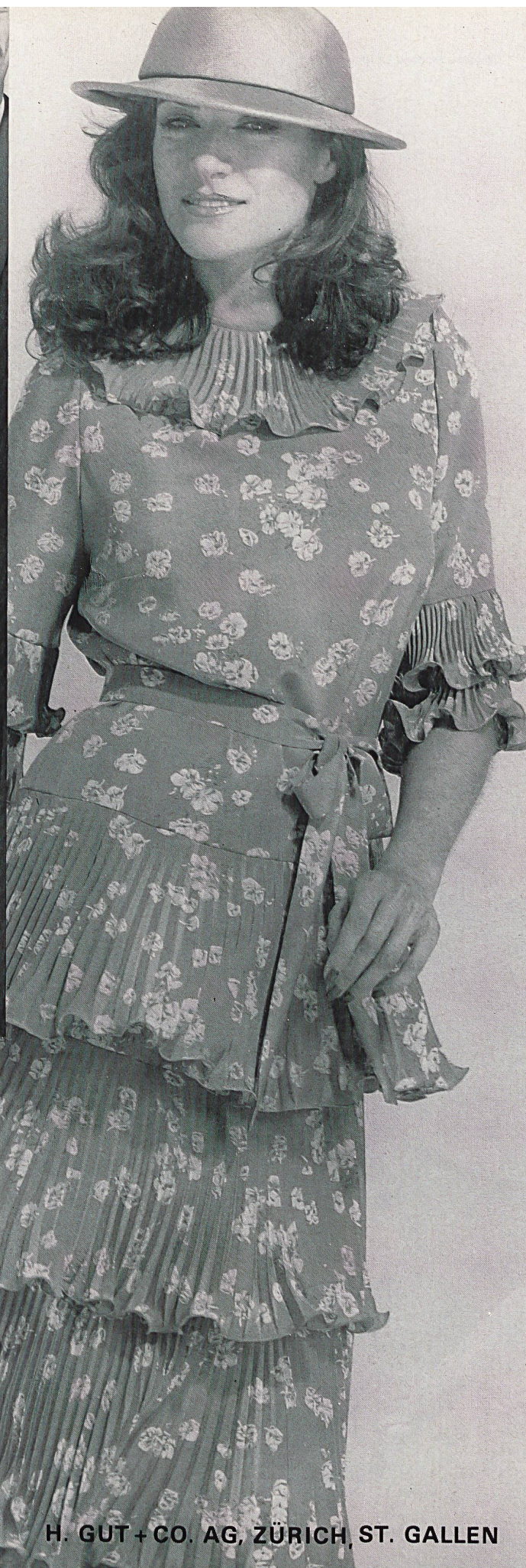
H. GUT + CO. AG, ZÜRICH, ST. GALLEN