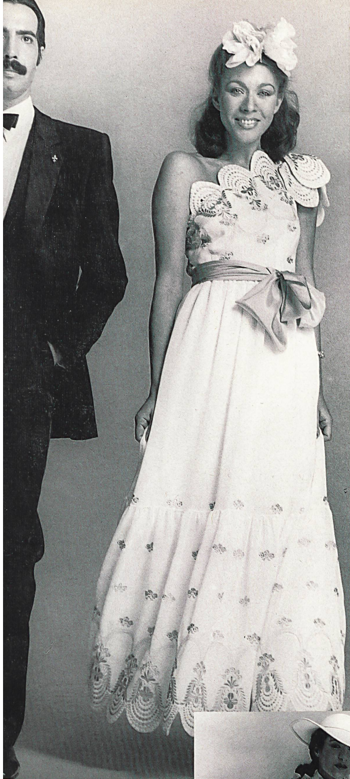
△ Stickerei-Bordüre auf Georgette.