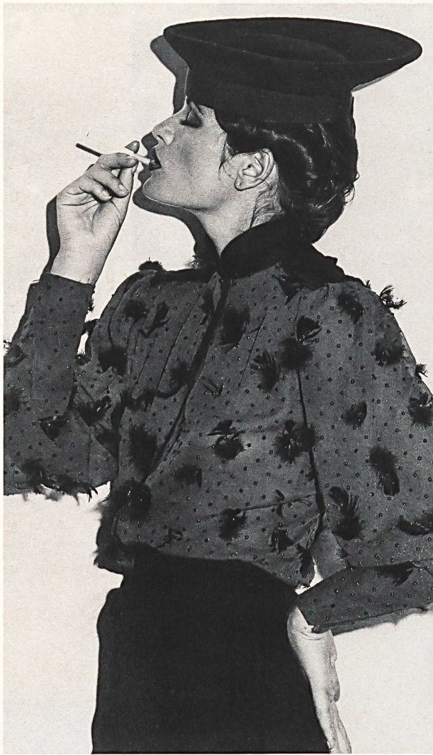
JAKOB SCHLAEFFER + CO. AG, ST. GALLEN Seiden-Georgette mit Fe- dern- und Steinchen-Appli- kationen / Georgette de soie avec applications de plumes et de gemmes / Silk georgette with appli- cations of feathers and gems.

Voiles et batistes de coton extra-fins, popelines et tissés en couleurs de classe pour le soir, satins brillants pour les chemises disco et jerseys hautement confortables pour les tenues de loisirs, voilà ce qu'offrent les industries textiles suisses pour les pièces indispensables de chaque garde-robe.