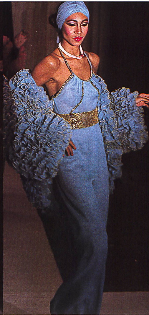
Broderie sur organza à volants smockés. MILENA FRANCESIO