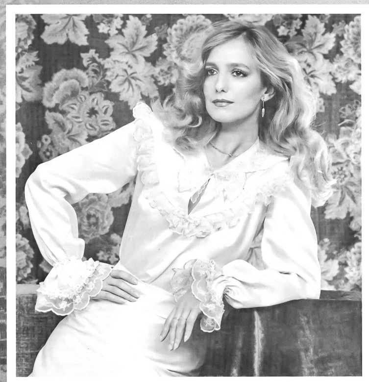
Bluse mit eingesetztem Stickereikragen sowie eingearbeiteten Tüll-Stickerei-Bändchen im romantischen Stil. / Blouse avec col de broderie ainsi que bandes brodées sur tulle, intriquées, en style romantique. / Blouse with embroidered collar and romantic-looking tulle embroidery bands.