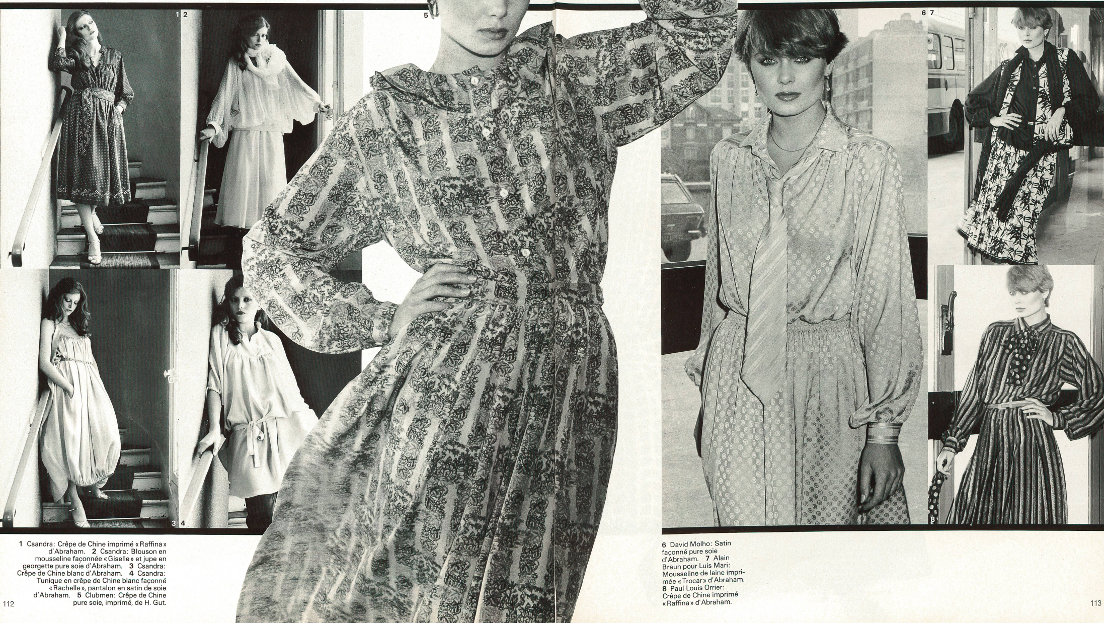
1 Csandra: Crêpe de Chine imprimé «Raffina» d'Abraham. 2 Csandra: Blouson en mousseline façonnée «Giselle» et jupe en georgette pure soie d'Abraham. 3 Csandra: Crêpe de Chine blanc d'Abraham. 4 Csandra: Tunique en crêpe de Chine blanc façonné «Rachelle», pantalon en satin de soie d'Abraham. 5 Clubmen: Crêpe de Chine pure soie, imprimé, de H. Gut.

noir, les costumes «futuristes» du nouveau film de SF «La Guerre des Etoiles». Mais l'élément essentiel de la nouvelle mode d'hiver est un style militaire qui, dans les collections des jeunes stylistes d'avant-garde, a provoqué la stupéfaction. Leurs manteaux, jaquettes et tailleurs pourraient être tirés d'un album d'uniformes et, au premier abord, ils ont suscité un certain étonnement. Mais si l'on fait abstraction de tous les accessoires «guerriers» tels que cein-