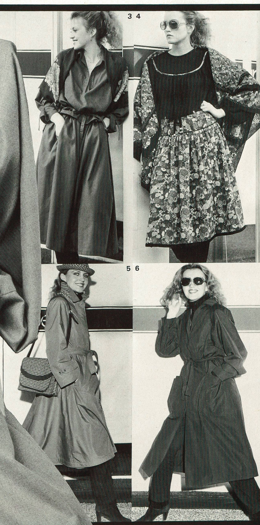
4 Alain Braun pour Luis Mari: Mousseline de laine avec écharpe assortie de H. Gut. 5 Fouks: Popeline en Diolène® et coton de Hausamann + Moos. 6 Martine Douvier: Popeline «Ambassador» de Hausamann + Moos. 7 Gino Carigliano: Laine quadrillée de Hausamann + Moos.