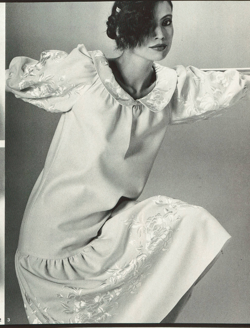
1 Ted Lapidus International: Broderie chimique de A. Naef. (Coiffure: Cédric pour Maurice Profit.) 2 Issey Miyake: «Feather-Cord» de Mettler-Teamtex. (Chapeau: Jean Barthe; chaussures: Stéphane Kélian.) 3 Ted Lapidus International: Broderie sur flanelle «Volalpa» de Jakob Schlaepfer. (Coiffure: Cédric pour Maurice Profit.)