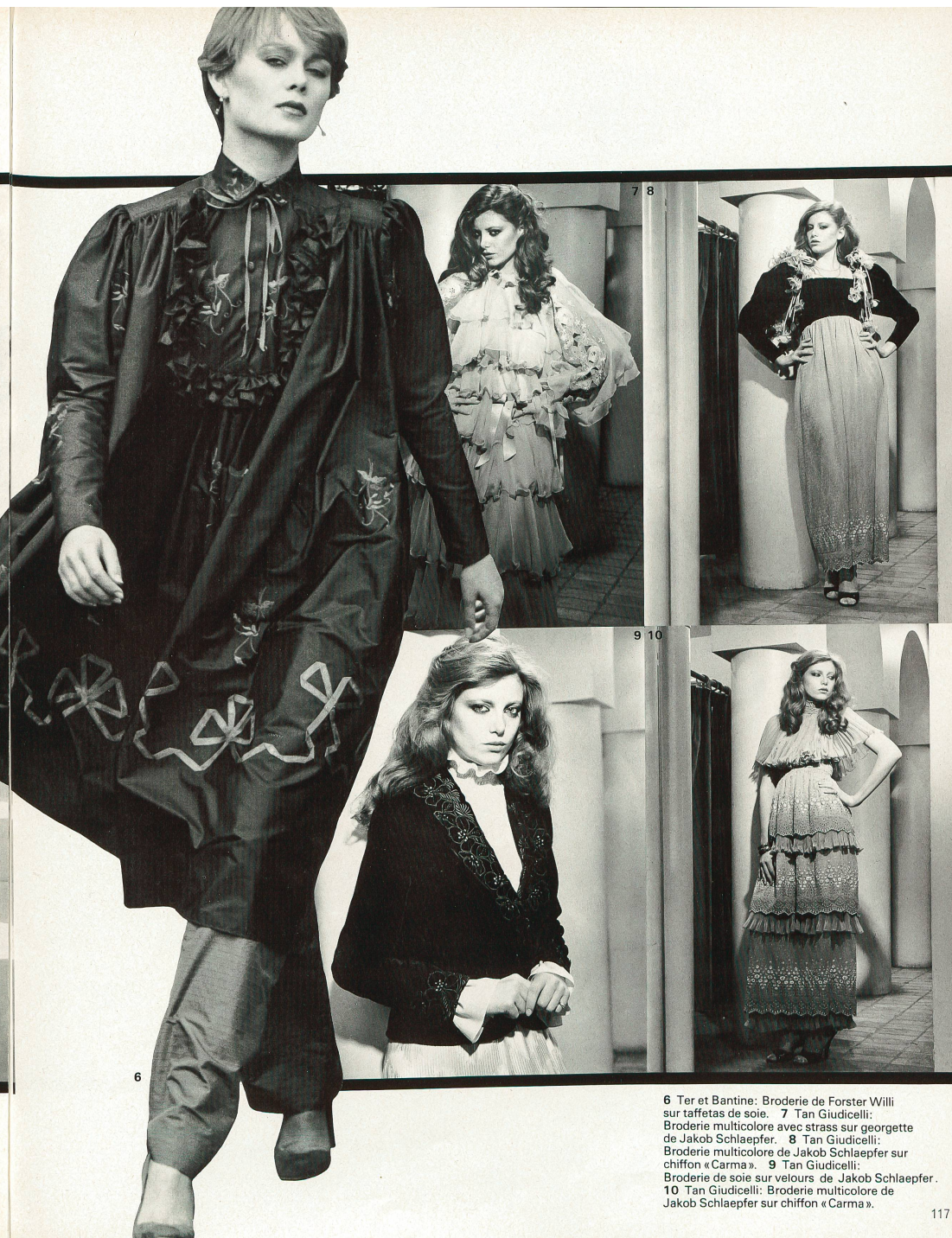
6 Ter et Bantine: Broderie de Forster Willi sur taffetas de soie. 7 Tan Giudicelli: Broderie multicolore avec strass sur georgette de Jakob Schlaepfer. 8 Tan Giudicelli: Broderie multicolore de Jakob Schlaepfer sur chiffon «Carma». 9 Tan Giudicelli: Broderie de soie sur velours de Jakob Schlaepfer. 10 Tan Giudicelli: Broderie multicolore de Jakob Schlaepfer sur chiffon «Carma».