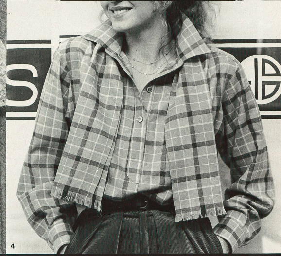
1 Ter et Bantine: Broderie multicolore sur tulle de Forster Willi. 2 Gudule: Broderie sur tulle de Forster Willi. 3 Rousseau: Jersey de coton de Mettler. 4 Jean Kolpa: Tissu laine « Lanella » de Hausamann + Moos.