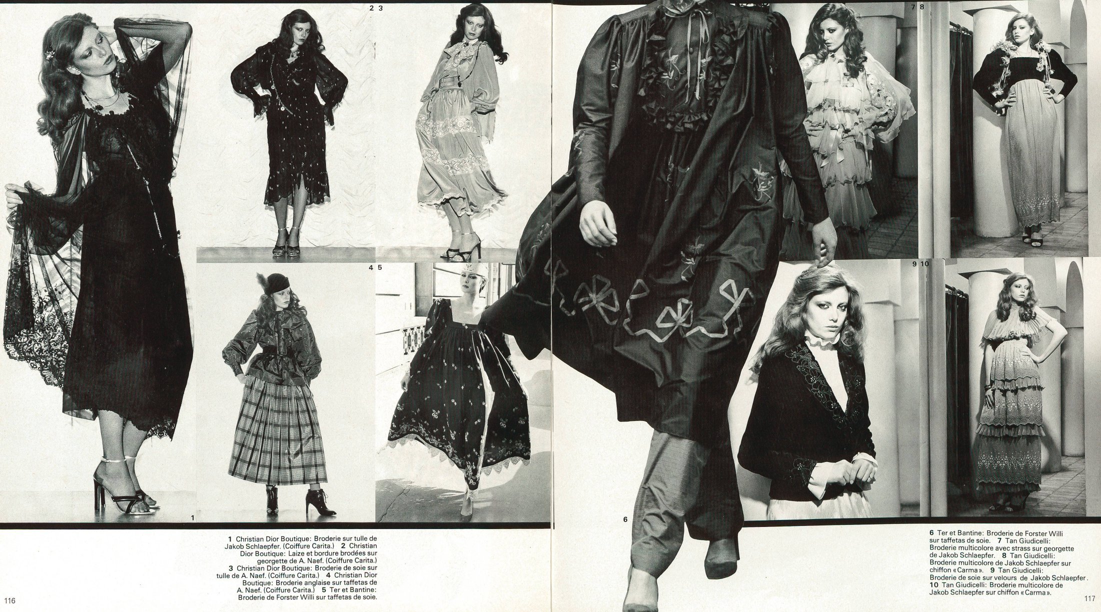
1 Christian Dior Boutique: Broderie sur tulle de Jakob Schlaepfer. (Coiffure Carita.) 2 Christian Dior Boutique: Laize et bordure brodées sur georgette de A. Naef. (Coiffure Carita.) 3 Christian Dior Boutique: Broderie de soie sur tulle de A. Naef. (Coiffure Carita.) 4 Christian Dior Boutique: Broderie anglaise sur taffetas de A. Naef. (Coiffure Carita.) 5 Ter et Bantine: Broderie de Forster Willi sur taffetas de soie.

des paletots et des pardessus, ils interprètent une ligne nettement masculine, avec des manteaux de style officier, ils adhèrent à la ligne militaire stricte. En revanche, des manteaux enveloppants à col châle donnent une note douce et féminine. Les tissus préférés pour les manteaux sont des cirés brillants, des réversibles à extérieur hydrofugé et intérieur chaud, de douillets mohairs, des tweeds, des draps de laine, du lama, du cachemire et des matelassés.