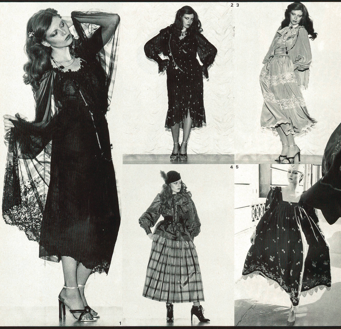
1 Christian Dior Boutique: Broderie sur tulle de Jakob Schlaepfer. (Coiffure Carita.) 2 Christian Dior Boutique: Laize et bordure brodées sur georgette de A. Naef. (Coiffure Carita.) 3 Christian Dior Boutique: Broderie de soie sur tulle de A. Naef. (Coiffure Carita.) 4 Christian Dior Boutique: Broderie anglaise sur taffetas de A. Naef. (Coiffure Carita.) 5 Ter et Bantine: Broderie de Forster Willi sur taffetas de soie.

des paletots et des pardessus, ils interprètent une ligne nettement masculine, avec des manteaux de style officier, ils adhèrent à la ligne militaire stricte. En revanche, des manteaux enveloppants à col châle donnent une note douce et féminine. Les tissus préférés pour les manteaux sont des cirés brillants, des réversibles à extérieur hydrofugé et intérieur chaud, de douillets mohairs, des tweeds, des draps de laine, du lama, du cachemire et des matelassés.