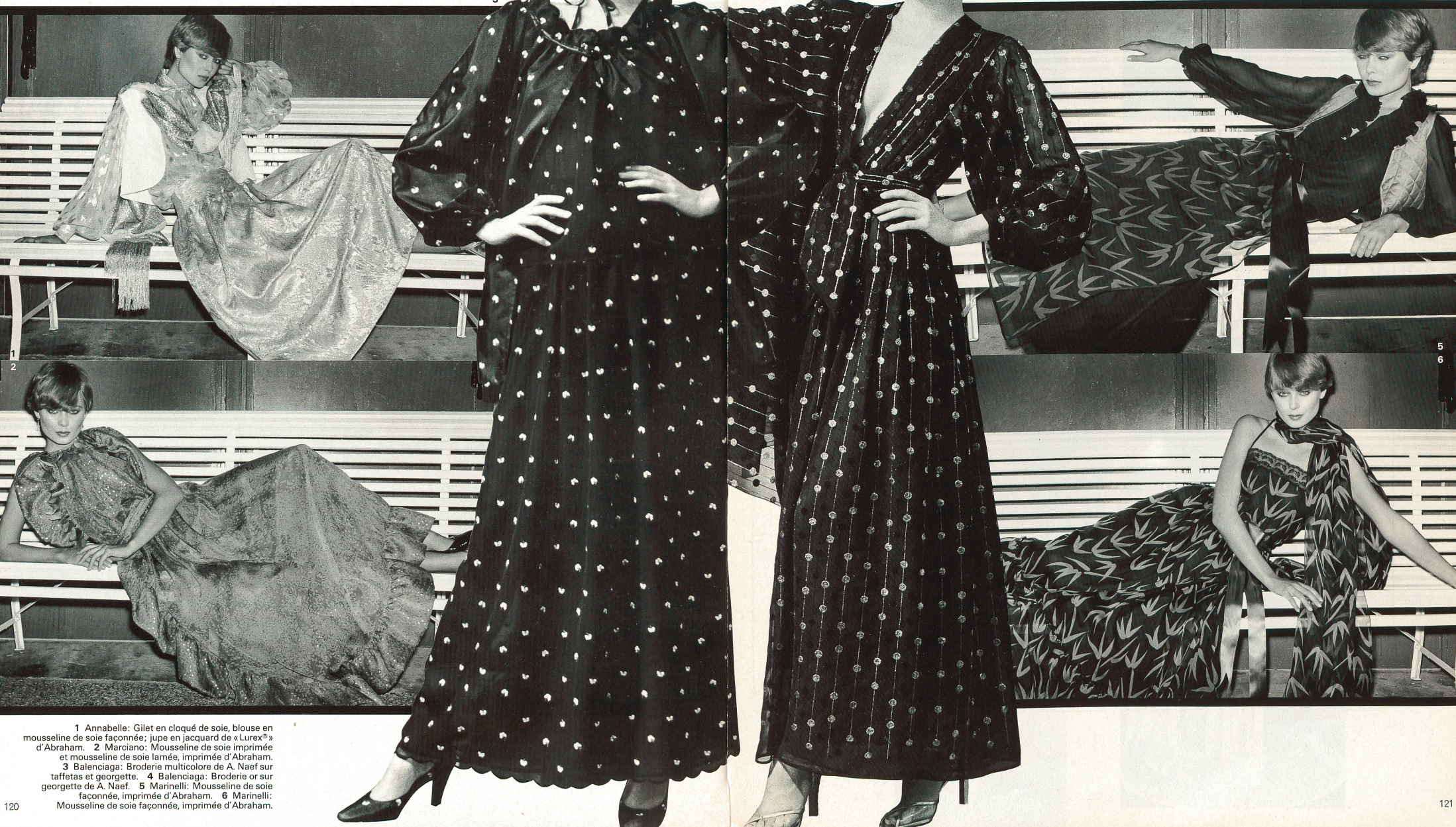
1 Annabelle: Gilet en cloqué de soie, blouse en mousseline de soie façonnée; jupe en jacquard de « Luxex® » d'Abraham. 2 Marciano: Mousseline de soie imprimée et mousseline de soie lamée, imprimée d'Abraham. 3 Balenciaga: Broderie multicolore de A. Naef sur taffetas et georgette. 4 Balenciaga: Broderie or sur georgette de A. Naef. 5 Marinelli: Mousseline de soie façonnée, imprimée d'Abraham. 6 Marinelli: Mousseline de soie façonnée, imprimée d'Abraham.

de laine fluides et de flatteurs velours, en noir, rouge feu, bleu canard, parme, fuchsia et violet confirment l'impression que la mode « discothèque », venant de New York, a atteint l'Europe. Sportive et fonctionnelle le jour, sexy, raffinée et fantaisiste le soir, c'est ainsi que la nouvelle mode correspond exactement à la psychologie de la femme moderne qui voudrait être tout à la fois énergique, active, féminine et sexy.