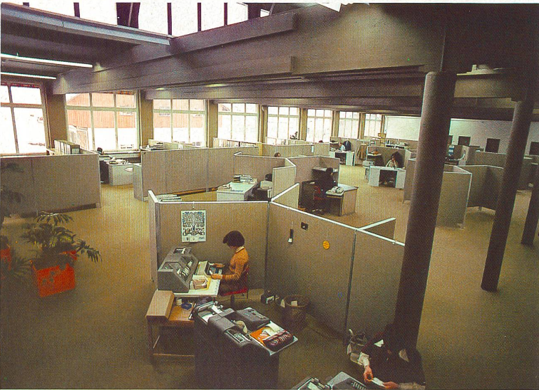
Der moderne Empfangsraum im umgebauten Verkaufsgebäude. La salle de réception moderne, dans le bâtiment de vente rénové. The modern reception room in the converted sales premises.