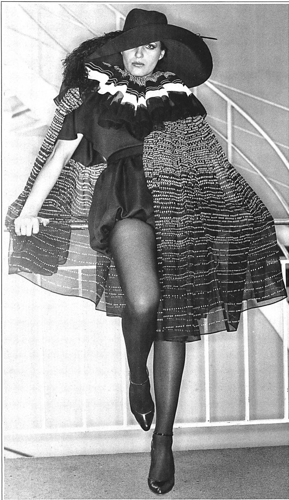
Vernissage: Cape aus bedrucktem Baumwollvoile « Marina » Modeschule der Stadt Wien