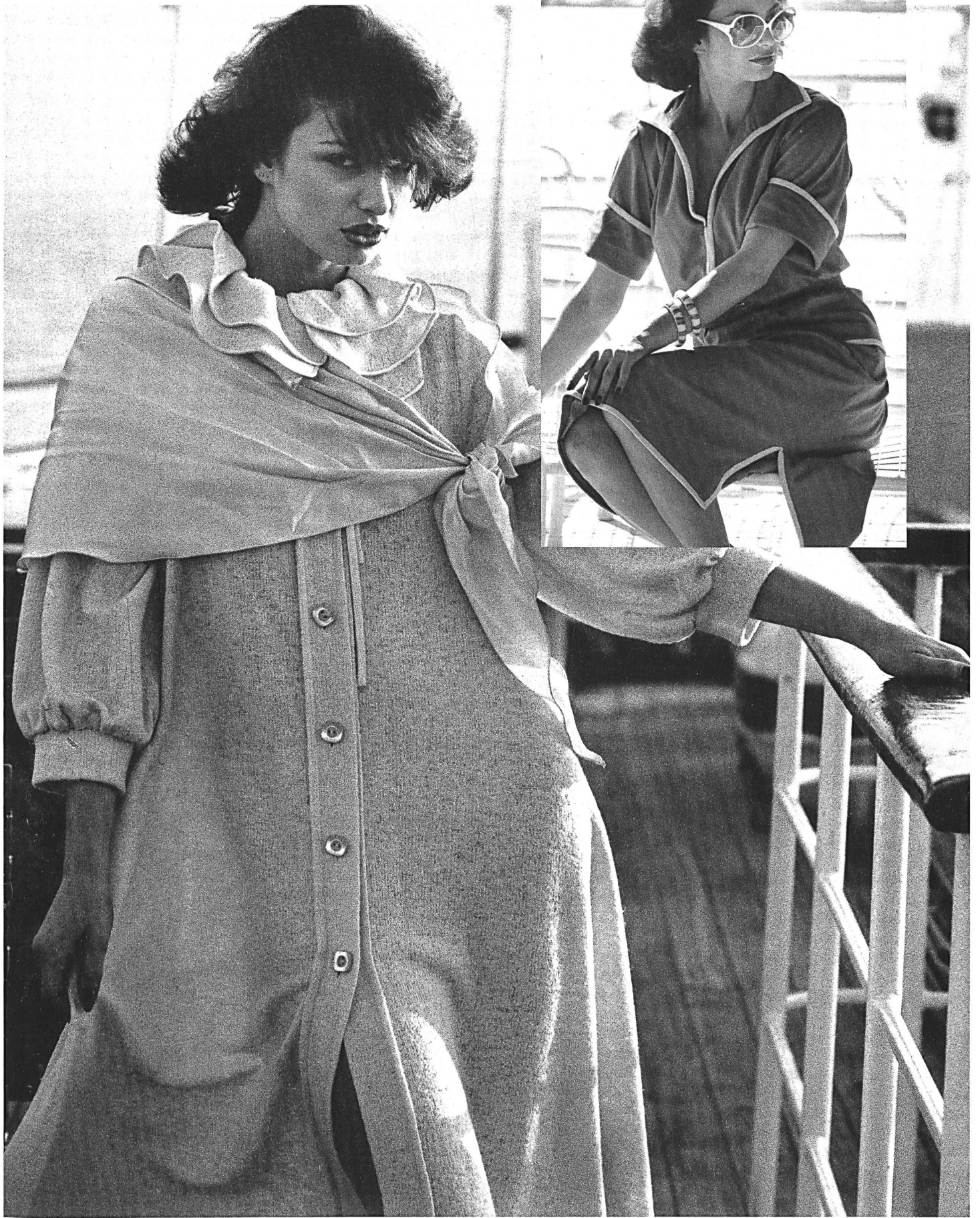
GUGELMANN, LANGENTHAL Maschenstoff aus Seide und Boucléwolle. (Mariella Ami, Rom)