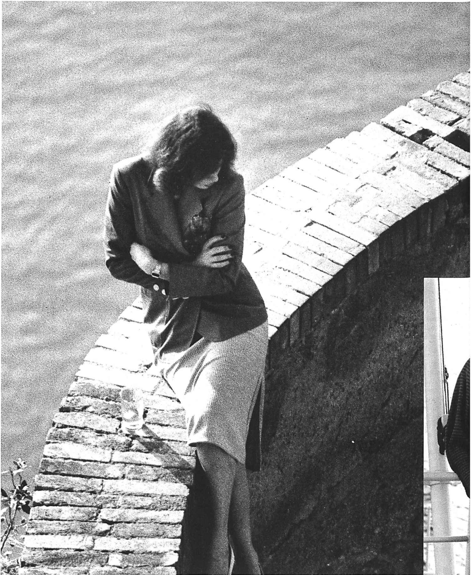
GUGELMANN, LANGENTHAL Maschenstoff aus Kaschmir und Seide. (Ognibene Zendman, Rom)