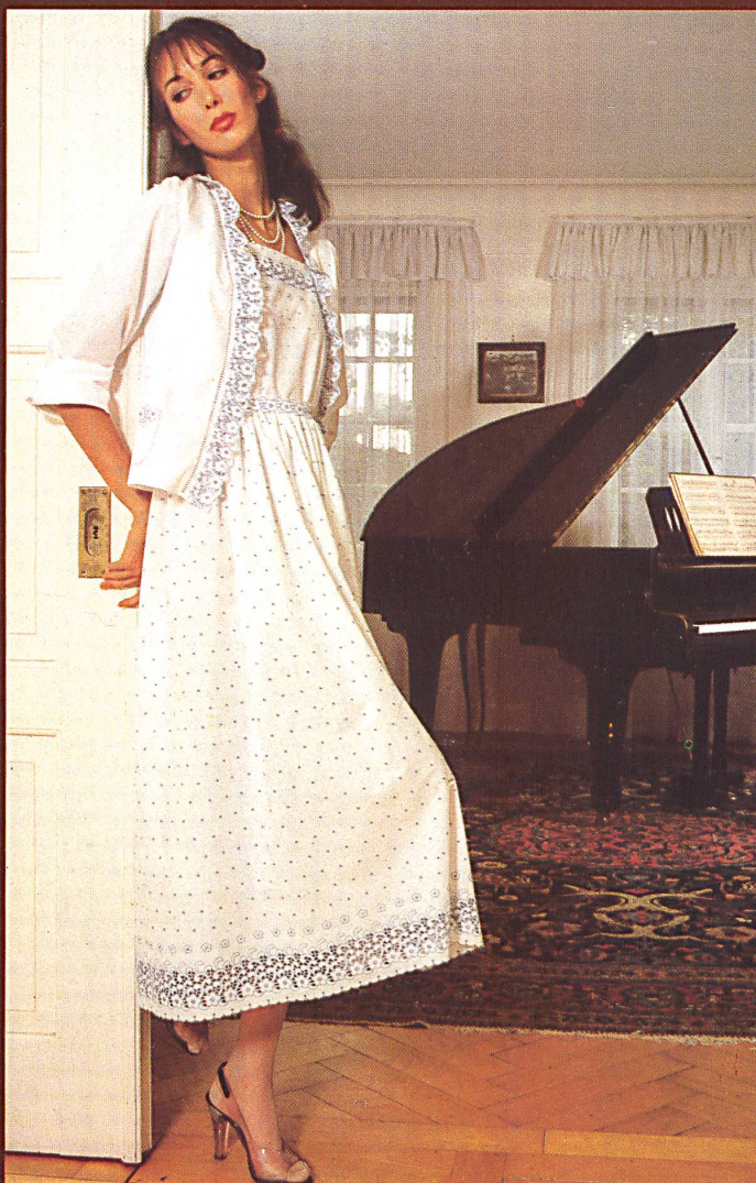
△ Farbige Richelieustickerei mit assortiertem Galon auf Baumwollbatist. Coloured Richelieu embroidery with matching braid on cotton batiste.

Die Firma Jacob Rohner AG, Rebstein, bringt ein von der Jahreszeit unabhängiges variationenreiches Stickerei-Programm, das in einzelne Themenkreise unterteilt ist. Dabei sind die verschiedenen Artikel jedes Sortimentes farblich und dessinmässig aufeinander abgestimmt: in der Kombination äusserst anregend, in der Verarbeitung für den Konfektionär völlig problemlos. Eine grosse Gruppe ist der Richelieustickerei nachempfunden mit ausgeprägtem Handarbeitscharakter, wobei die Dessins der Nouveautés von den Allovern mit Bordürenabschluss über Volants, Bänder und Galons in verschiedenen Breiten bis zu den Taschen und Einsätzen entweder Ton-in-Ton auf rustikalem Baumwolltoile oder farbig auf Baumwollbatist gestickt sind. Eine weitere Spezialität ist Richelieustickerei auf Baumwoll-Cretonne