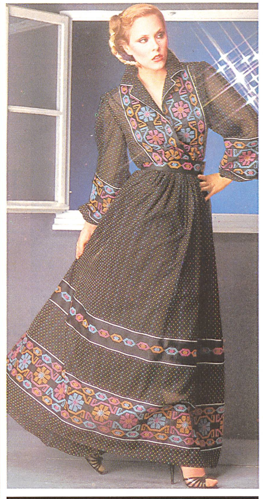
△ REICHENBACH + CO. AG. ST. GALLEN Colour-woven dotted design and cross-stitch edging on cotton / Buntgewebtes Punktedessin und Kreuzstichbordüre auf Baumwolle / Dessin de points tissés en couleur et bordure au point de croix sur coton.