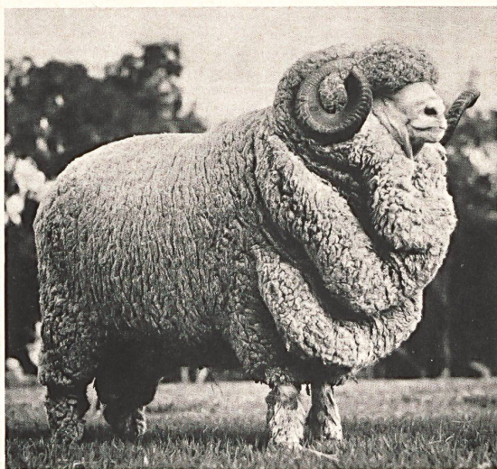
Australischer Merino-Schafbock «Haddon Rig»