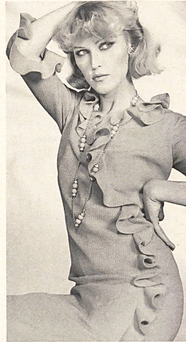
ROBT. SCHWARZENBACH + CO. AG THALWIL

The colour card favours fresh, luminous, sunny colours like bright yellows, blues and reds. Original colour effects with violet, light leafy green and bluish pink represent the new look and at the same time show the influence of haute couture fabrics on the commercial collections, which always benefit from the gratifyingly large use of Swiss silks by Paris couture houses.