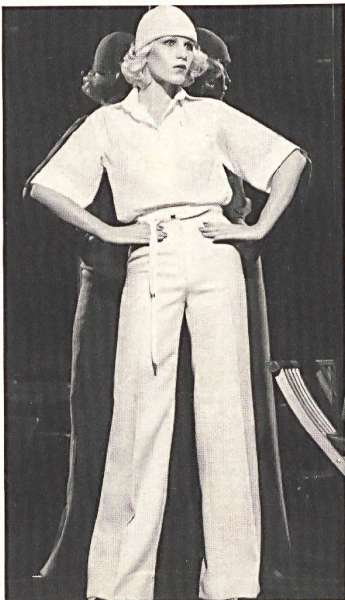
3 Coton à surface lisse. (Courrèges, Paris)