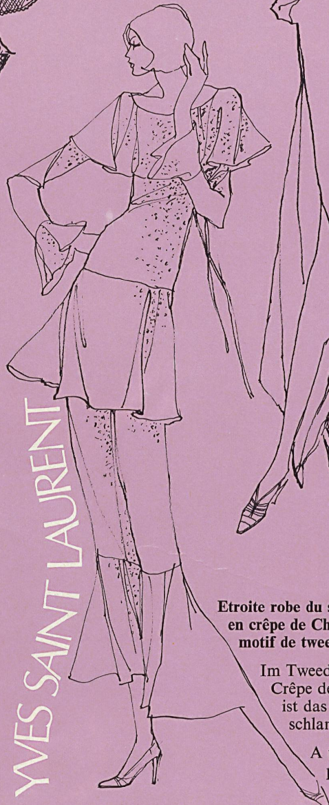
Etroite robe du soir volantée en crêpe de Chine imprimé d'un motif de tweed bleu et gris.