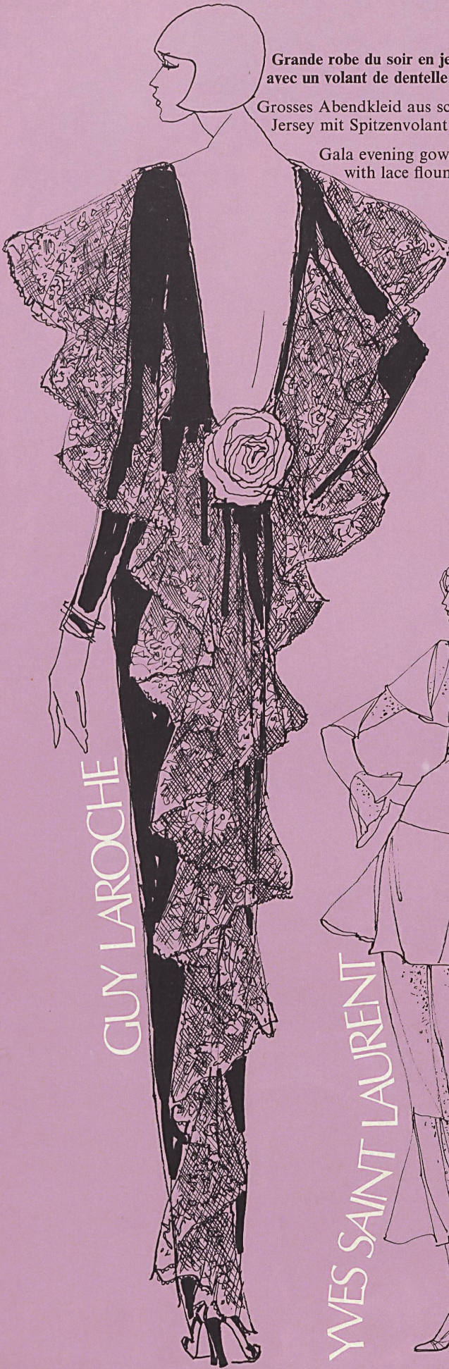
Grande robe du soir en jersey noir avec un volant de dentelle dans le dos.