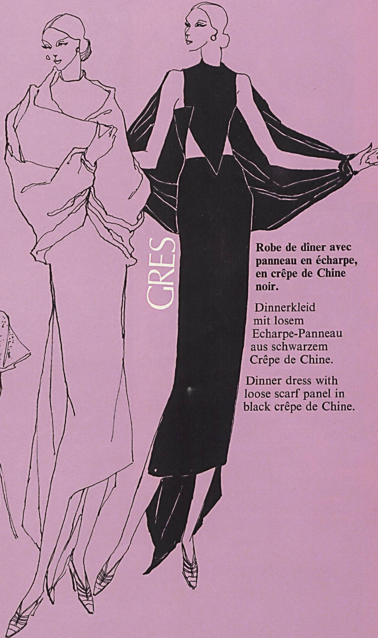
Robe de dîner avec panneau en écharpe, en crêpe de Chine noir.