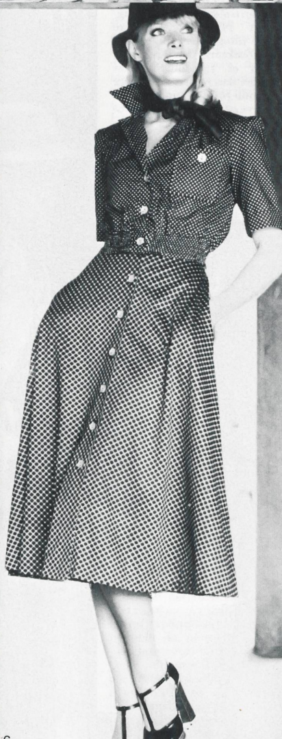
6 CHRISTIAN FISCHBACHER CO. AG, ST. GALLEN Skirt: mercerized cotton jersey; top: printed dots on "Sandro" cotton batiste / Rock: Mercerisierter Baumwolljersey; Oberteil: Tupfendruckdessin auf Baum- wollbatist « Sandro » / Jupe: jersey de coton mercerisé; haut: « Sandro », batiste de coton à impression de pois (Mary Quant, London)

Hats by Edward Mann, London Jewellery by Adrien Mann, London