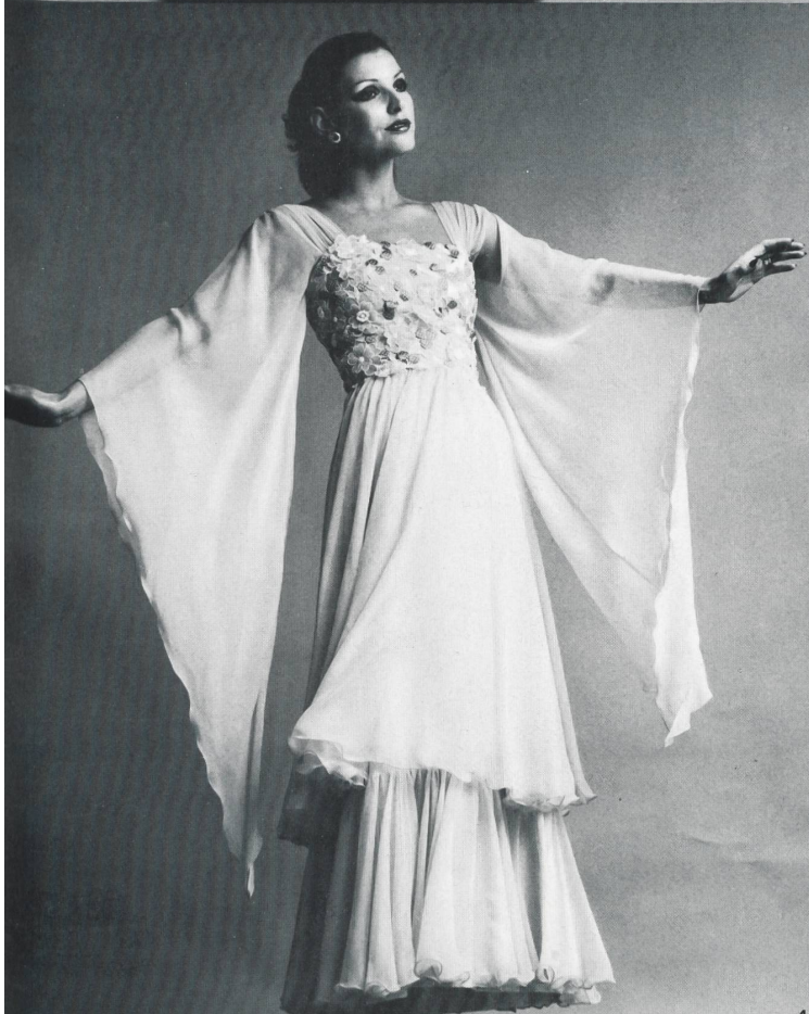
5 FILTEX AG, ST. GALLEN Printed granny style cotton crêpon / Bedruckter Baumwoll- crepon im Grossmutter-Stil / Crêpon de coton imprimé en style « grand-mère » (Anne Gough at Gemini, London)