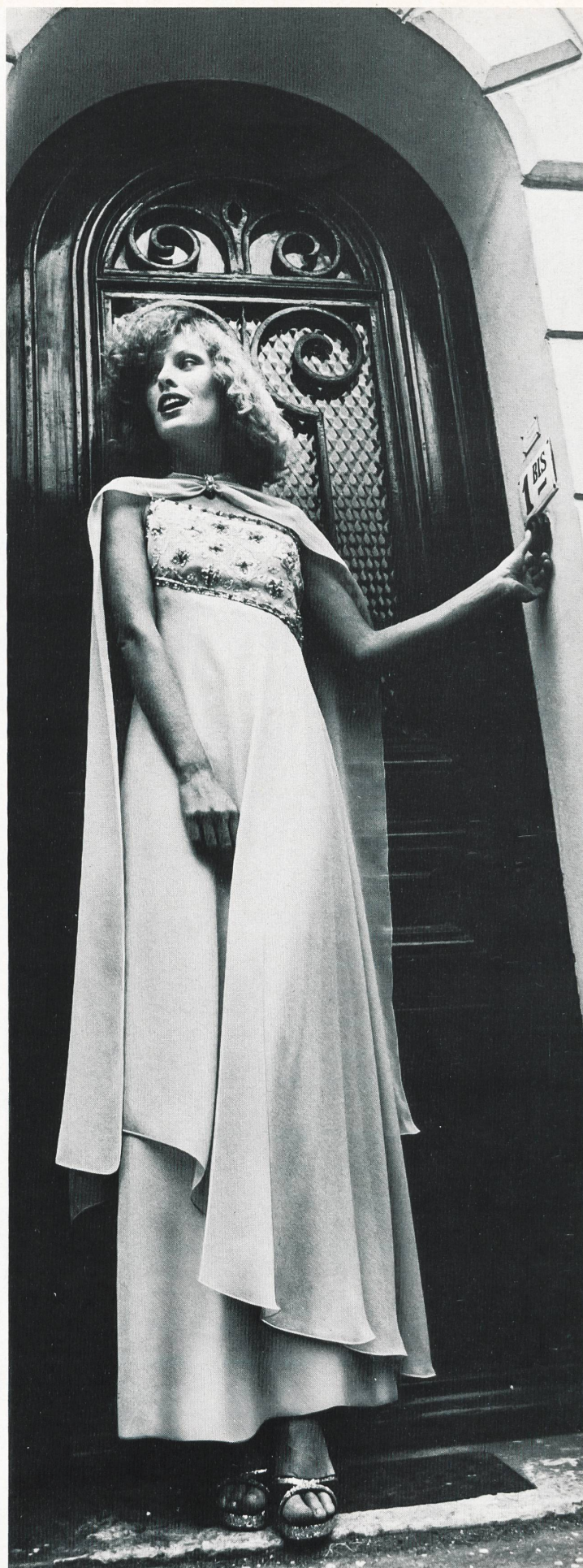
ABRAHAM AG, ZÜRICH « Sira », reinseidener Crêpe Georgette / « Sira », crêpe georgette pure soie / "Sira", pure silk crêpe georgette (Marie Roc|Csandra, Paris).

L'industrie suisse de la soie n'est plus représentée maintenant que par quelques entreprises, mais celles-ci sont d'une capacité de production extraordinaire.