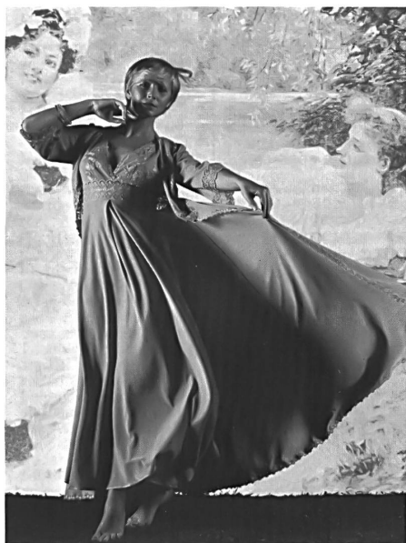
UNION AG, ST. GALLEN Séduisant saut-de-lit porté sur une chemise de nuit longue, sans manches, en crêpe de nylon turquoise. — Verführerisches Negligé mit Canotte in Türkisblau aus Nylon Crêpe. — Seductive nightgown and negligé in turquoise blue nylon crêpe.

possible, providing them with a wide variety of permanent finishes and decorating them with romantic floral prints. They have also mixed cotton fibres with synthetics or used chemical fibre fabrics and jerseys to create articles that require no ironing. The choice of fabrics for fashionable night attire is extraordinarily rich, as also the selection of embroidery trimmings offered by the Swiss embroidery industry, so that nightdress manufacturers have practically unlimited sources from which to draw their inspiration. The embroidery grounds are subject to the same conditions as the fabrics and are therefore also easy-care. Embroidery edgings, broderie anglaise, floral motifs embroidered in the form of allovers, bands and braids of various widths, embroidered flounces and single embroidery motifs are but a few of the specialities renewed every year to satisfy the current trends. Mention should also be made of embroideries combined with prints, for which broderie anglaise is a top favourite.