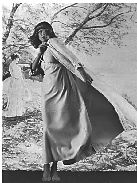
BAERLOCHER & CO. AG, RHEINECK Jolie chemise de nuit avec saut-de-lit en Tutorette® pur coton à repassage superflu, imprimé en turquoise et blanc. — Hübsches Nachthemd mit Negligé in Tutorette®, weiss/türkis bedruckt aus 100 % Baumwolle, bügelfrei. — Alluring nightdress and negligé in Tutorette®, white/ turquoise pure cotton non-iron print.

(Modèles/Modelle/Models: Mylady AG, Rheineck)