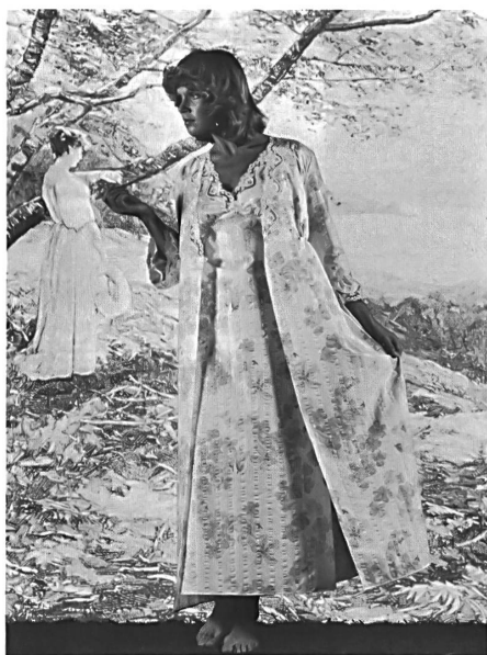
BAERLOCHER & CO. AG, RHEINECK Chemise de nuit avec saut-de-lit en Tutorette® pur coton, à repassage superflu, en bleu clair uni. — Uni hellblaues Nachthemd mit Negligé in Tutorette® aus 100 % Baumwolle, bügelfrei. — Pale blue nightdress with negligé in pure cotton non-iron Tutorette®.

(Modèles/Modelle/Models: International Monarch, Biancheria d'Arte)