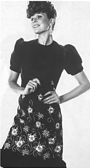
▲ JACOB ROHNER AG, REBSTEIN Saphir- blaues Samtkleid mit schöner Sticke- rei in leuchtenden Farben. — Robe de velours bleu saphir avec belle broderie en couleurs lumineuses. — Sapphire blue velvet dress with distinctive embroidery edging.