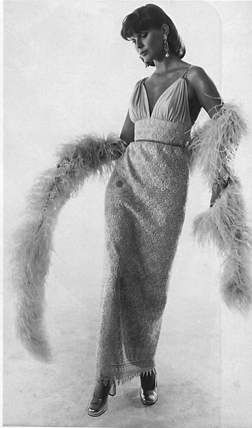
A. NAEF AG, FLAWIL Langes Abendkleid aus bunt bestickter Spachtelspitze in Samt. — Robe du soir longue en broderie multicolore, découpée, sur velours. — Long evening dress in colour-embroidered velvet cut-out lace.