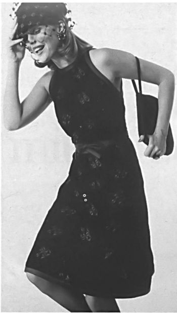
▼ « NELO » J. G. NEF & CO. AG, HERISAU Kleines Cocktailkleid aus schwarzem besticktem Samt. — Petite robe de cocktail en velours brodé noir. — Little cocktail dress in black embroidered velvet.