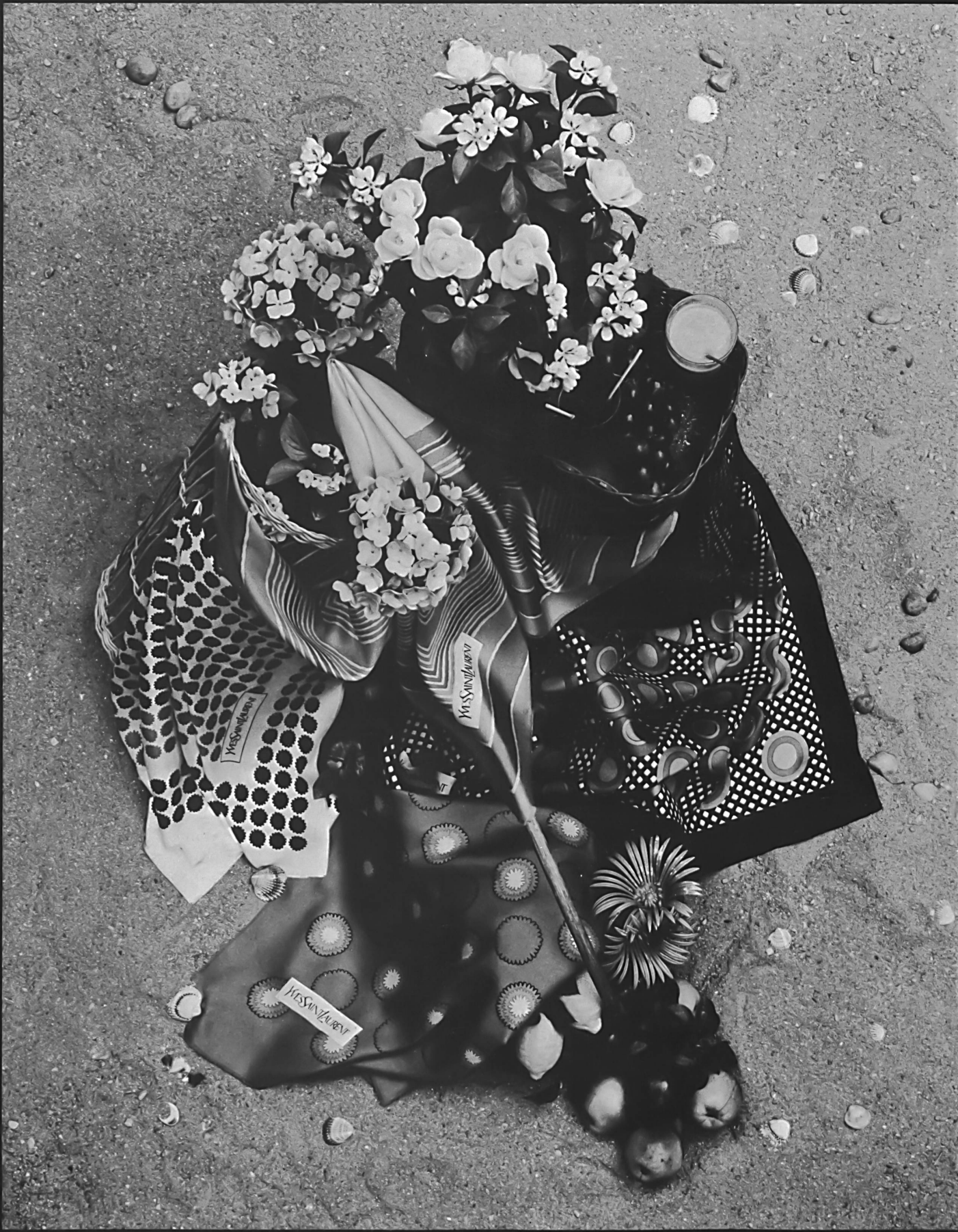
Abraham AG, Zürich