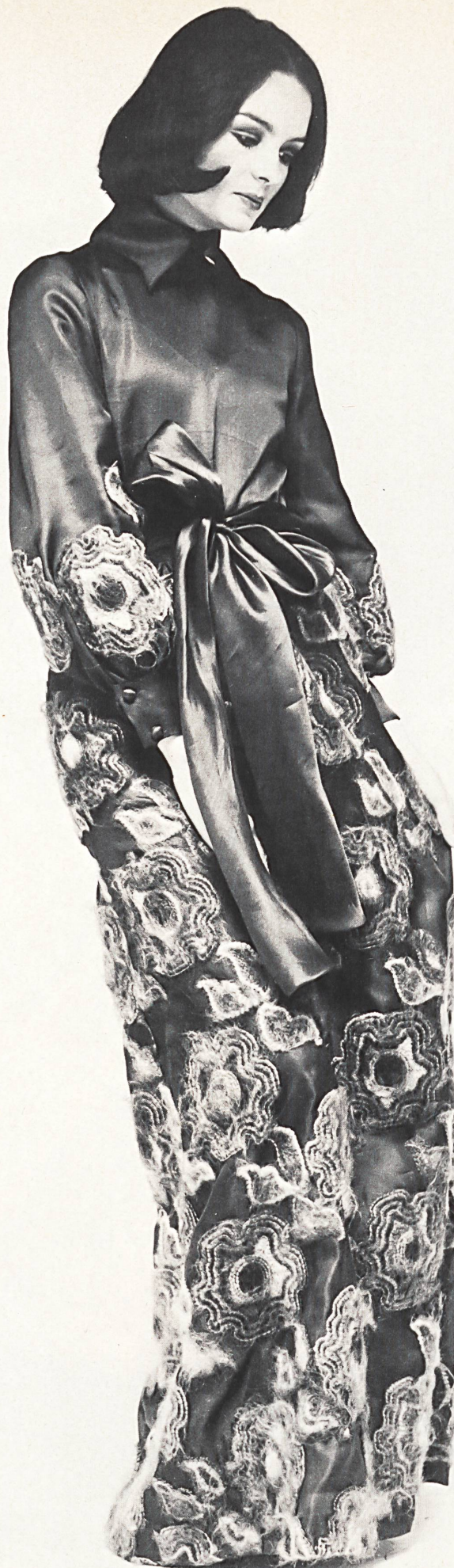
BALESTRA Broderie en fil ombré mohair, rouge et vert sur organza satin marine de Jakob Schlaepfer & Cie SA, Saint-Gall