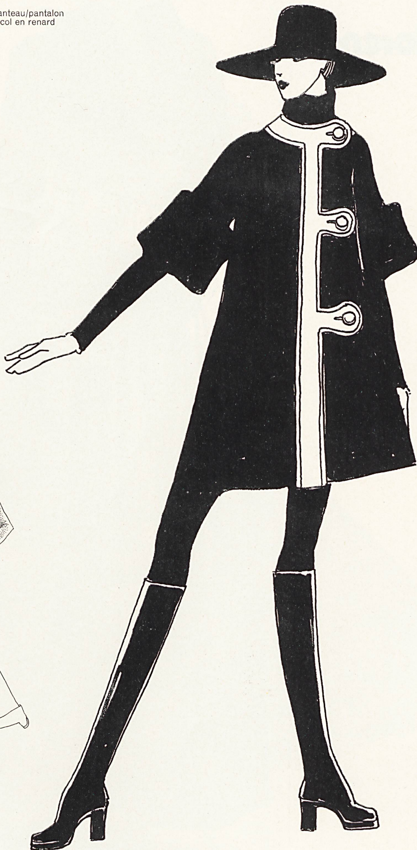
▶ Lanvin · Ensemble manteau/pantalon en tweed brun avec col en renard orange