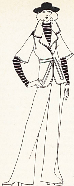
Louis Féraud · Ensemble pantalon en laine blanc cassé, pullover mohair à rayures blanches