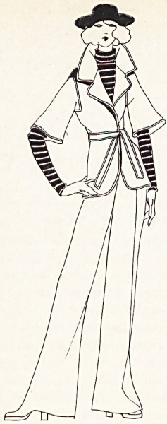
Louis Féraud · Ensemble pantalon en laine blanc cassé, pullover mohair à rayures blanches