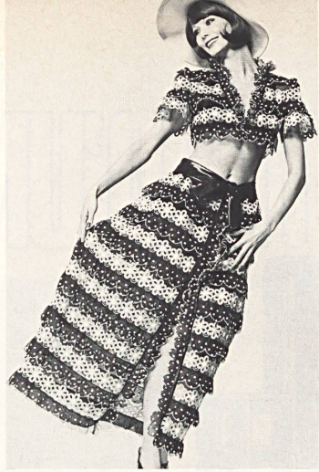
9. Jungdliches Sommer-Abendkleid aus Organza mit weisser und sonnengelber Stickerei von J. G. Nef & Co. AG, Herisau