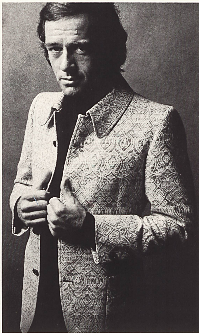
CHRISTIAN FISCHBACHER CO., ST. GALL «Opera» multicoloured jacquard