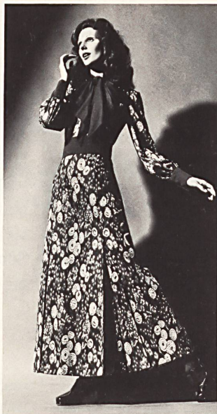
◀ Jacquard-Jersey aus reiner Baumwolle

Das Material ist geschmeidig und fließend,