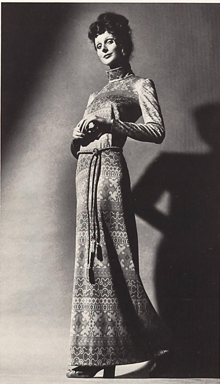
▼ Jersey aus reiner Baumwolle mit Jacquardmuster