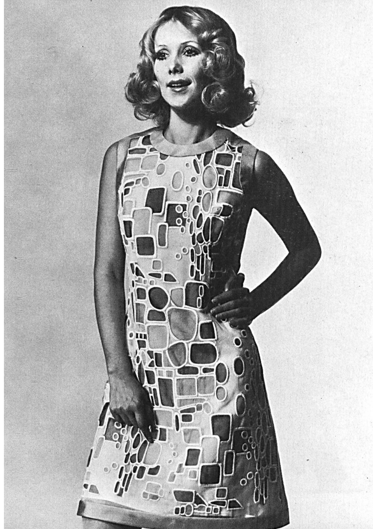
◀ FORSTER WILLI & CIE SAINT-GALL Organza de soie brodé et imprimé Modèle Toni Schiesser, Francfort