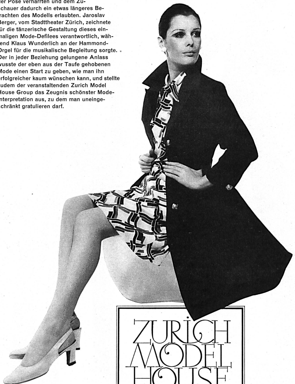
KATEX | KALTENMARK & CIE AG, ZÜRICH Bedrucktes Reinseidenkleid mit Unimantel, ein Spezialmodell für grosse Grössen.

Group präsentierte die drei Versionen in verschiedenen Kreationen, wobei Mini kniebedeckend war, Midi bis Mitte Wade reichte und Maxi beim Knöchel endete. Welch grosse Rolle auch das neue Hemdblusenkleid spielt, bewies das sechste Bild « Le Chemisier », dem der folkloristisch angehauchte « Peasant-Look » folgte. Mit « Garden Party » und « Dîner aux Chandelles » brachte man die festliche Garderobe ins richtige Rampenlicht. Es würde schwerfallen, nachträglich einzelnen Bildern den Vorzug zu geben, denn jedes, unter dem Gesamtmotto « Adam und Eva » stehend, war in sich vollkommen. Geschickt wusste man bei der getanzten Schau trotzdem die einzelnen Modelle in Form und Linie gut zur Geltung zu bringen, indem die Mannequins immer wieder vor einem supponierten Fotografen in entsprechender Pose verharrten und dem Zuschauer dadurch ein etwas längeres Betrachten des Modells erlaubten. Jaroslav Berger, vom Stadttheater Zürich, zeichnete für die tänzerische Gestaltung dieses einmaligen Mode-Defiles verantwortlich, während Klaus Wunderlich an der Hammond-Organ für die musikalische Begleitung sorgte. Der in jeder Beziehung gelungene Anlass wusste der eben aus der Taufe gehobenen Mode einen Start zu geben, wie man ihn erfolgreicher kaum wünschen kann, und stellte zudem der veranstaltenden Zurich Model House Group das Zeugnis schönster Mode-Interpretation aus, zu dem man uneingeschränkt gratulieren darf.