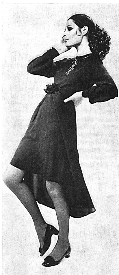
H. & A. HEIM AG, ZÜRICH Midi-Kleid aus Crêpe Georgette (ICI).