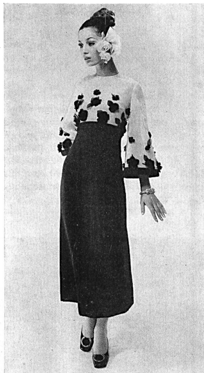
EI-EI AG, ZÜRICH Cocktail- und Abendkleid aus Organza mit applizierten Blumenmotiven aus gleichem Material.