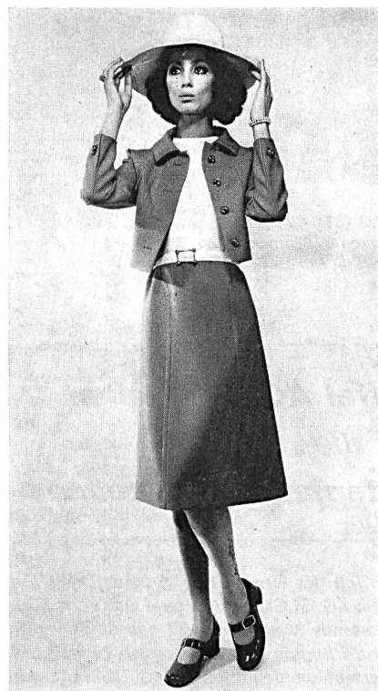
R. CAFADER & CO., ZÜRICH Zweifarbigen Frühjahrsensemble mit Jacke, aus reiner Schurwolle.