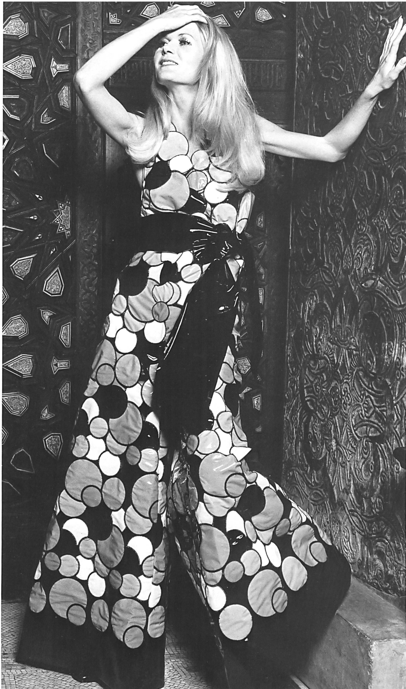
CLIVE, LONDON Cut-out vinyl applications on organza, by JAKOB SCHLAEPFER & CO. LTD., ST-GALL