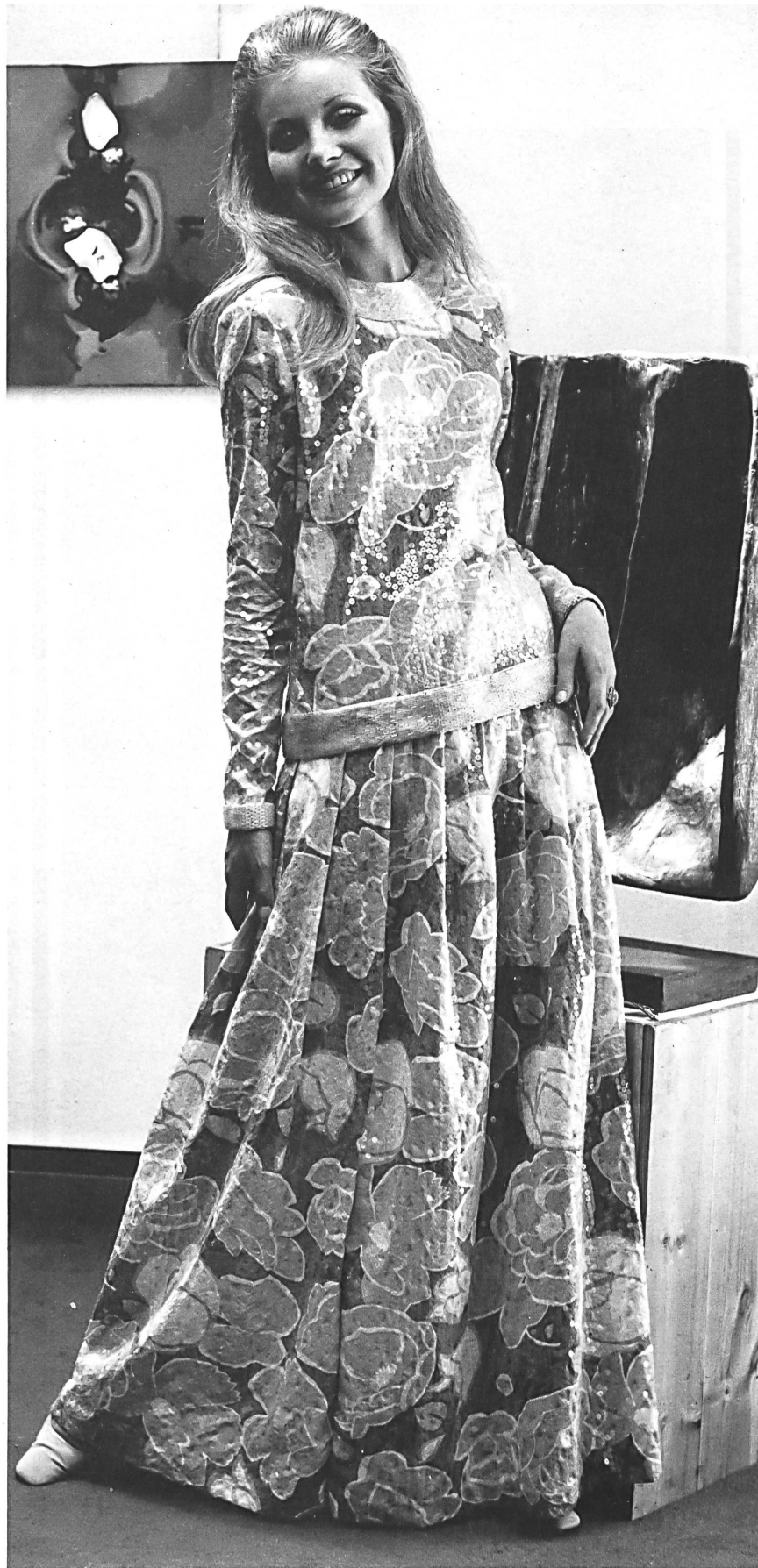
▲ CLIVE, LONDON Spangled embroidery by JAKOB SCHLAEPFER & CO. LTD., ST-GALL on print by HAUSAMMANN TEXTILES LTD., WINTERTHUR