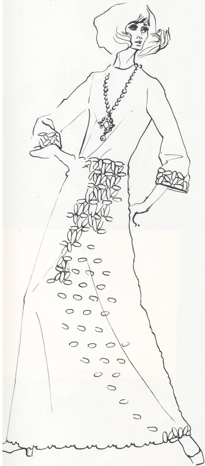
A. NAEF & CO. AG FLAWIL Winterliches Festkleid aus weisser Woll-Guipure mit Lederoberteil Modell Toni Schiesser Frankfurt