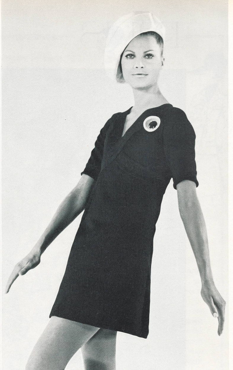
TED LAPIDUS Soieries de Robt. Schwarzenbach & Cie, Thalwil