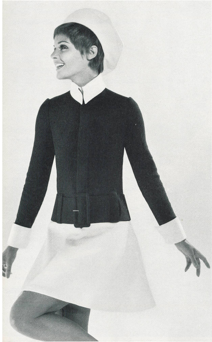
TED LAPIDUS Soieries de Robt. Schwarzenbach & Cie, Thalwil