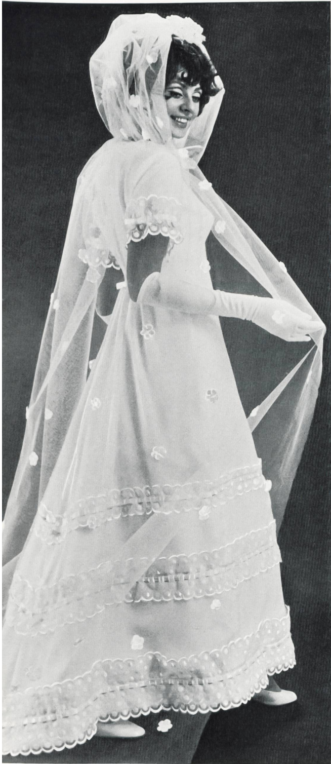
Bestickte Organdi-Gallons mit Durchzugsband appliziert auf Organza Stickerei: UNION AG, ST. GALLEN