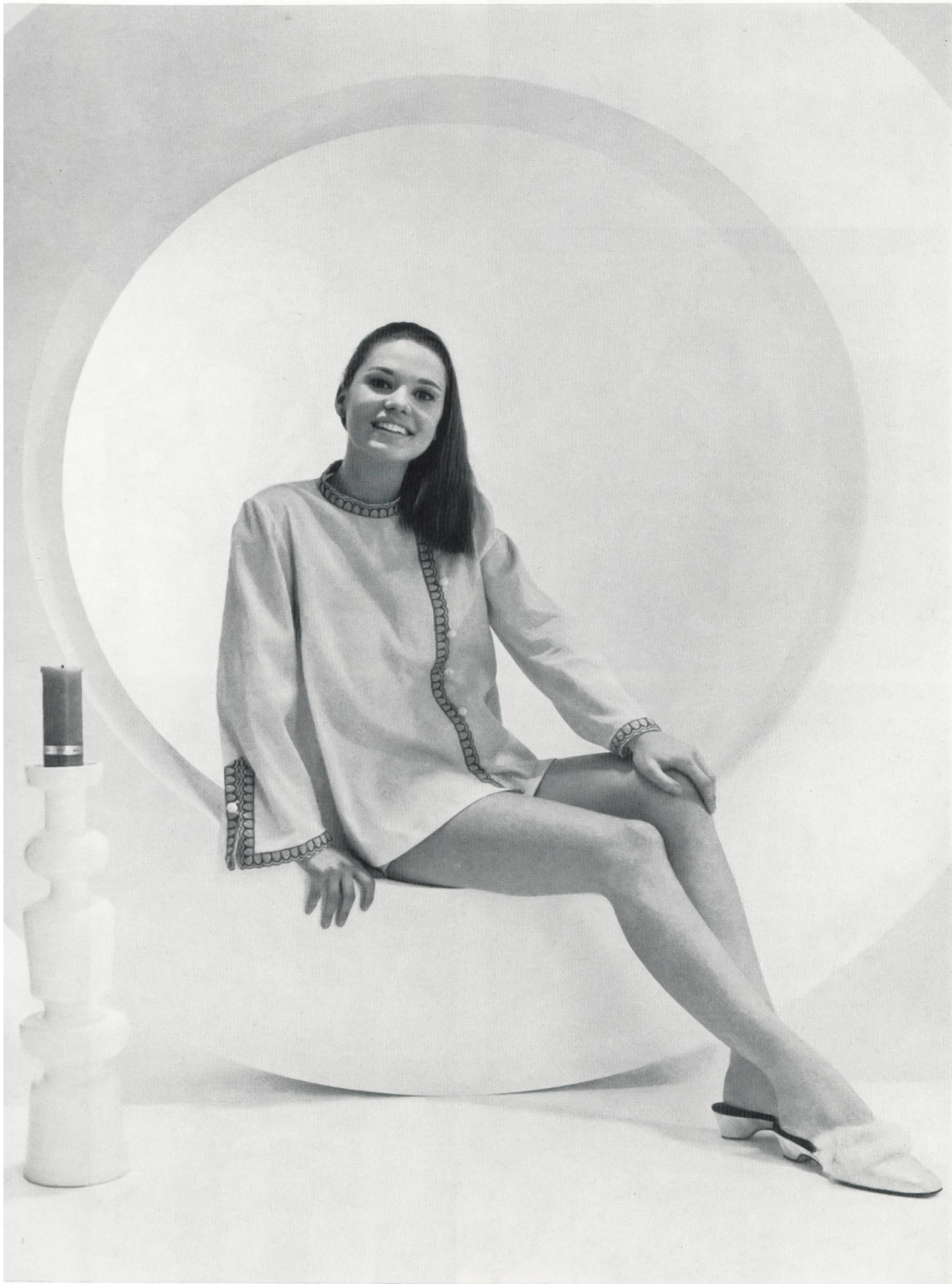
Ravissant baby-doll en crêpe écorce, repassage superflu, avec bordure brodée bicolore Tissu : Bærlocher & Cie, Rheineck Bordure : Union S.A., Saint-Gall

Il est probable que l'on reverra souvent les trois charmantes débutantes dans la carrière de cover-girl sur les photos de modèles réalisés au moyen des spécialités saint-galloises en tissus de coton et en broderies.