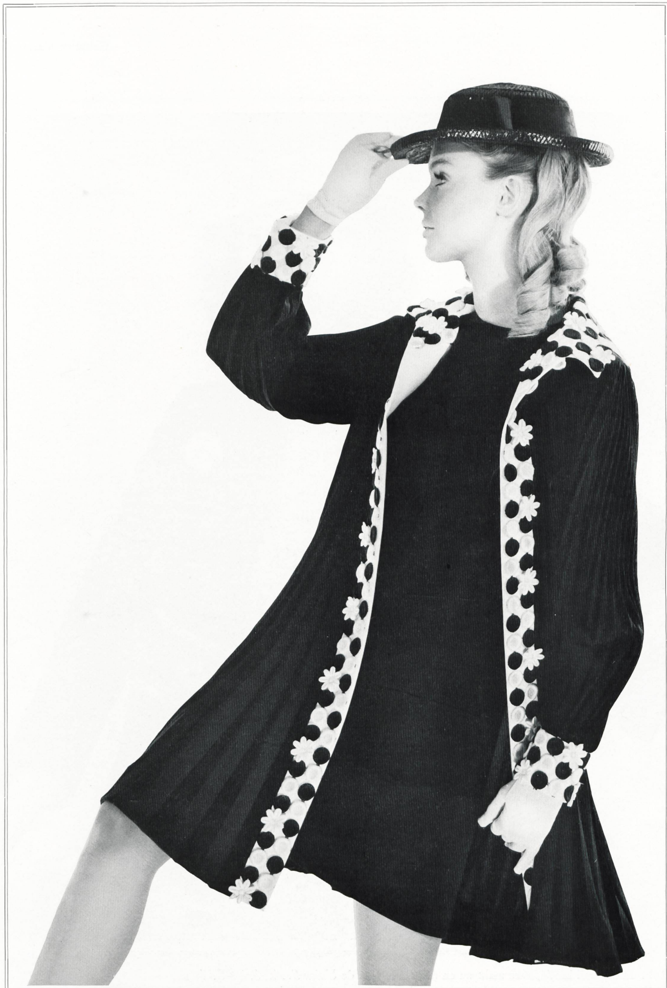
Guipure blanche et marine de A. Naef & Cie S. A., Flawil