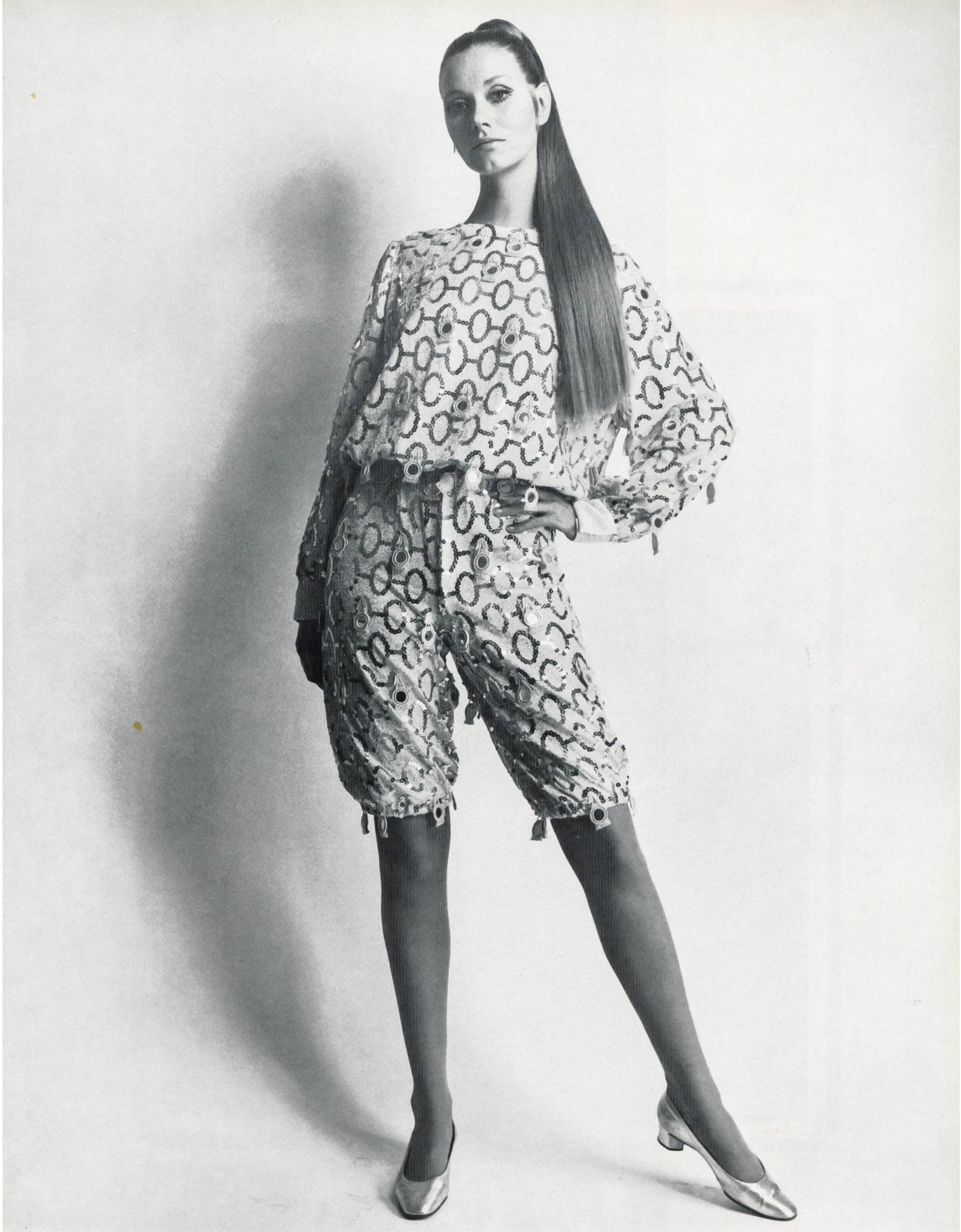
JAKOB SCHLAEPFER & CO. LTD., ST-GALL Spangled embroidery on Lurex® jersey with appliqué mirror motifs Model: Barocco, Rome