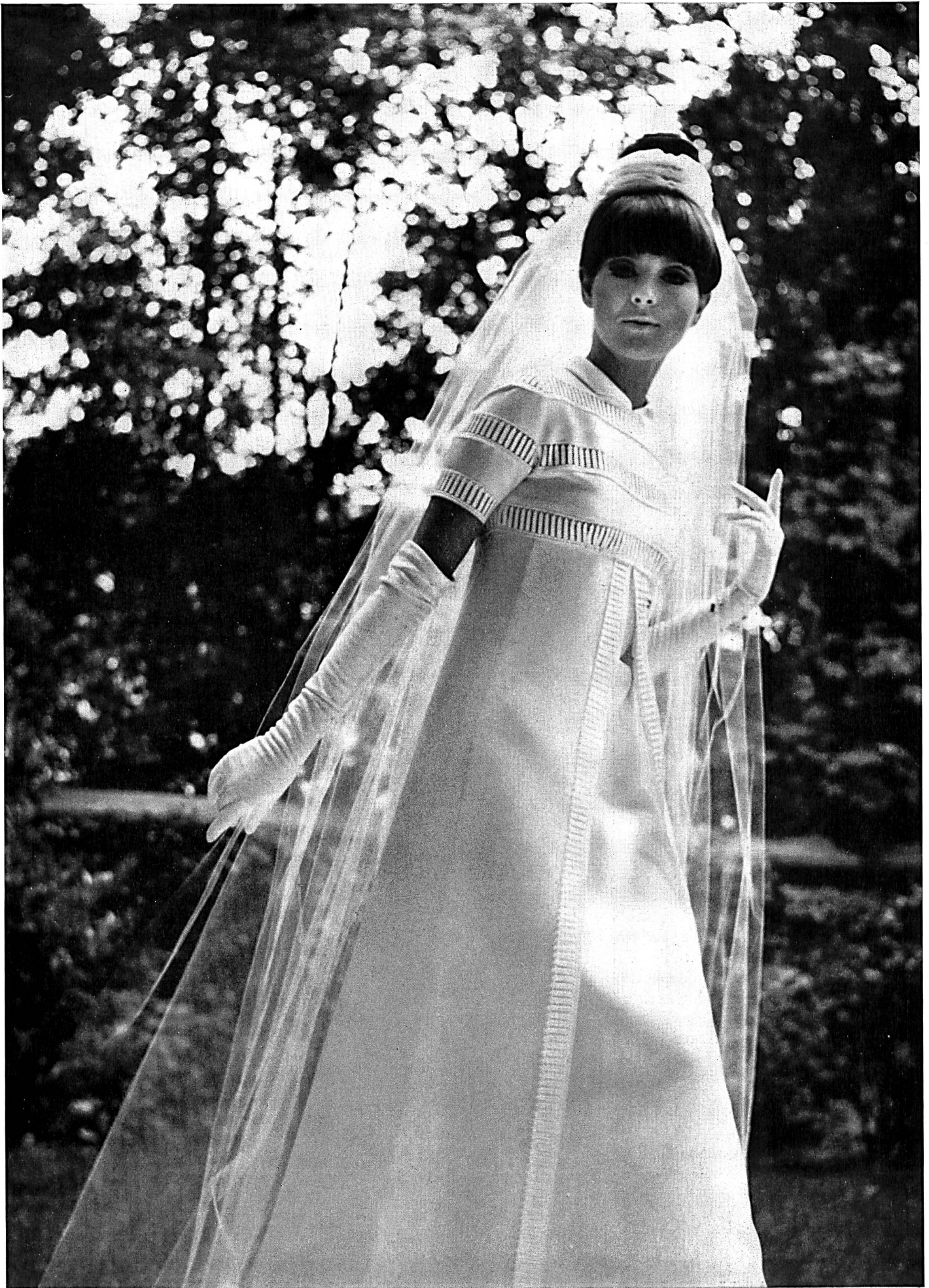
Carven Forster Willi & Co., Saint-Gall Bande de batiste brodée