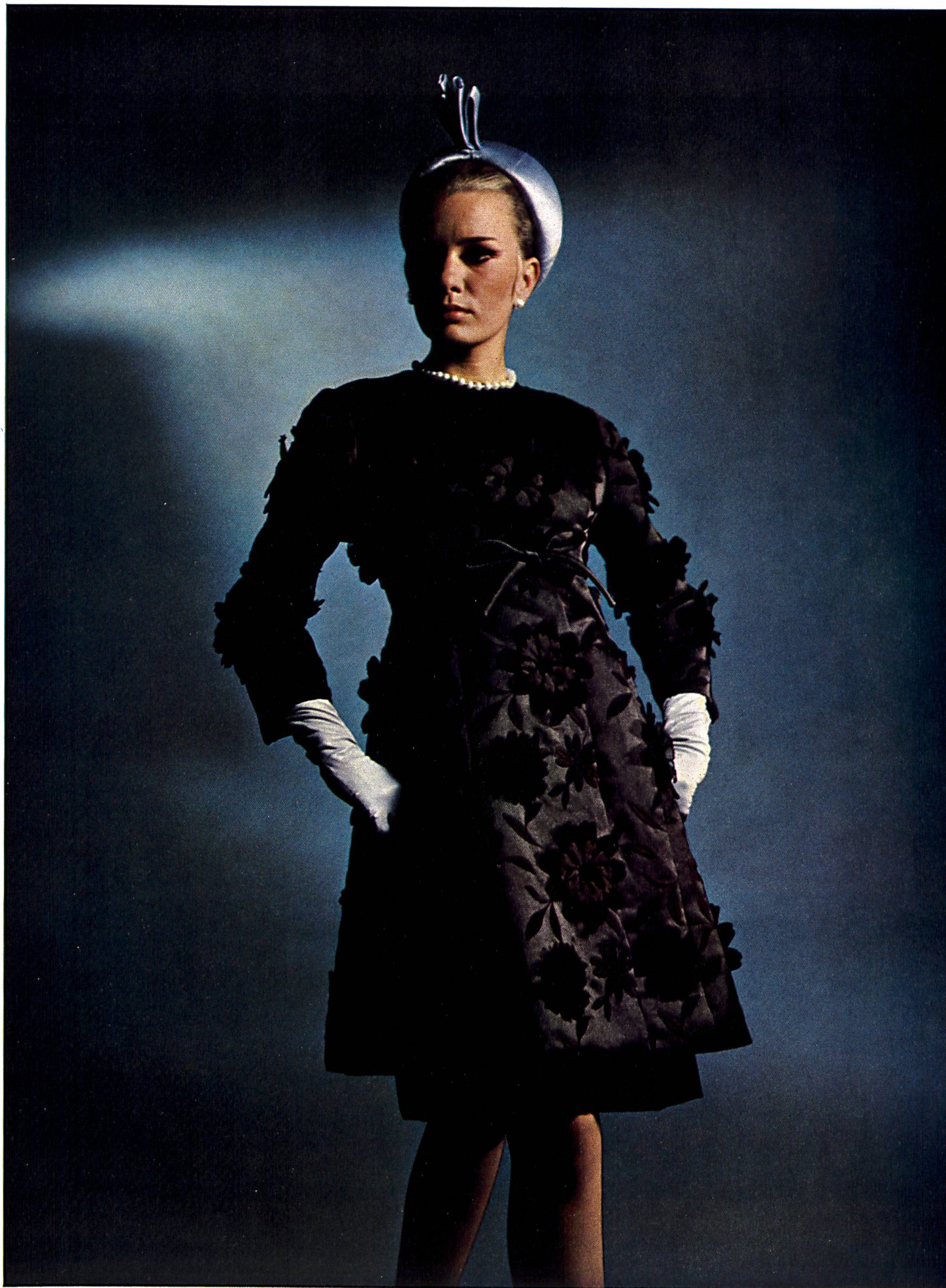
Hubert de Givenchy Broderie de Saint-Gall