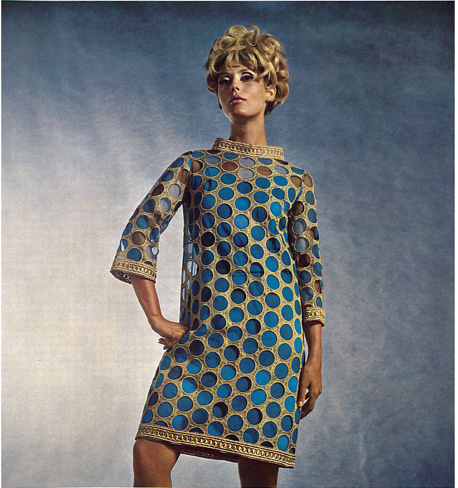
FORSTER WILLI & CIE, SAINT-GALL Broderie or sur tissu lamé avec fond multicolore