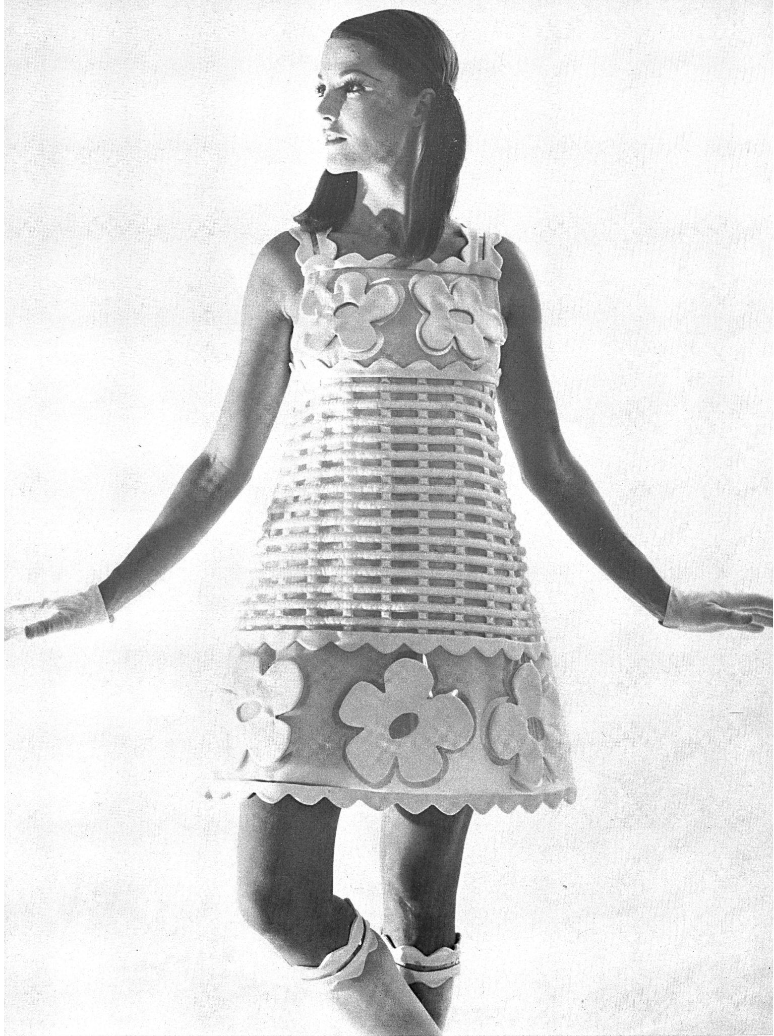
A. NAEF & CIE S.A., FLAWIL Laize matelassée