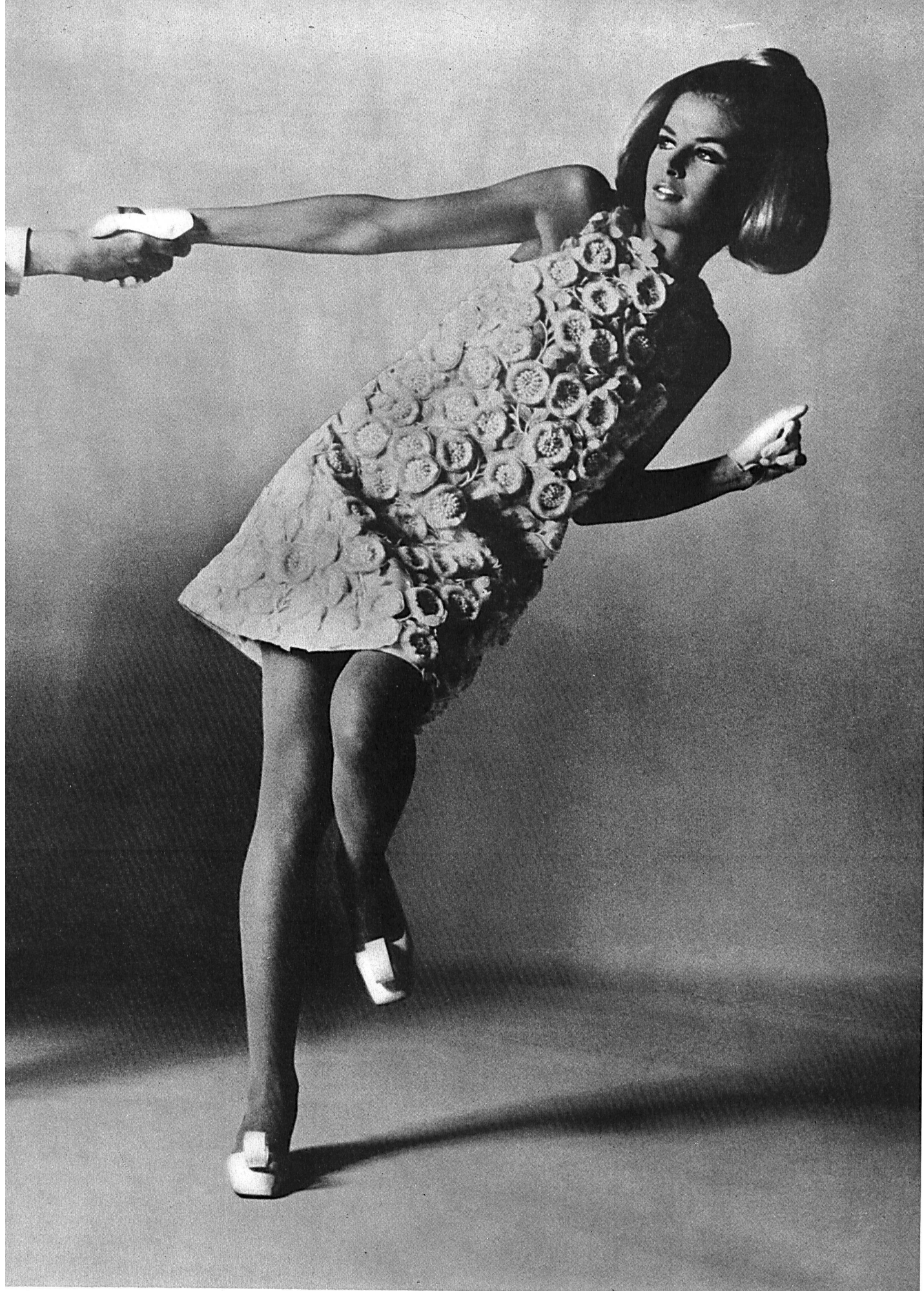
Bischoff Textil AG, St. Gallen Organdi avec applications de broderie découpée Modèle: Emanuel Ungaro, Paris