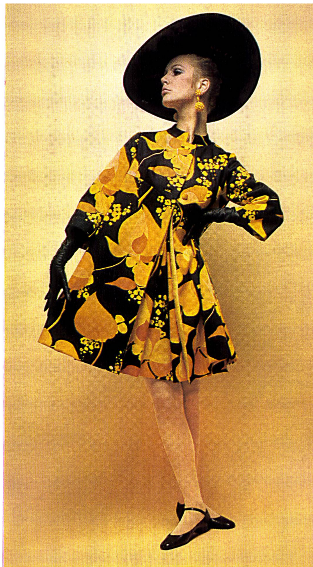
Robe de cocktail en broderie découpée avec applications de guipure et manteau de soie Basra Cocktail dress in cut-out embroidery with guipure applications and Basra silk coat

L'Orchestre de la Suisse romande et le Collegium musicum de Zurich donneront, avec le concours de solistes suisses, plusieurs concerts au cours desquels seront exécutées des œuvres de compositeurs suisses. D'autres solistes helvétiques de grand renom se produiront au cours de deux concerts de musique de chambre. Enfin, à l'occasion de la fête nationale suisse auront lieu, le 1 er août, d'importantes manifestations folkloriques à la salle de l'Expo-Théâtre.