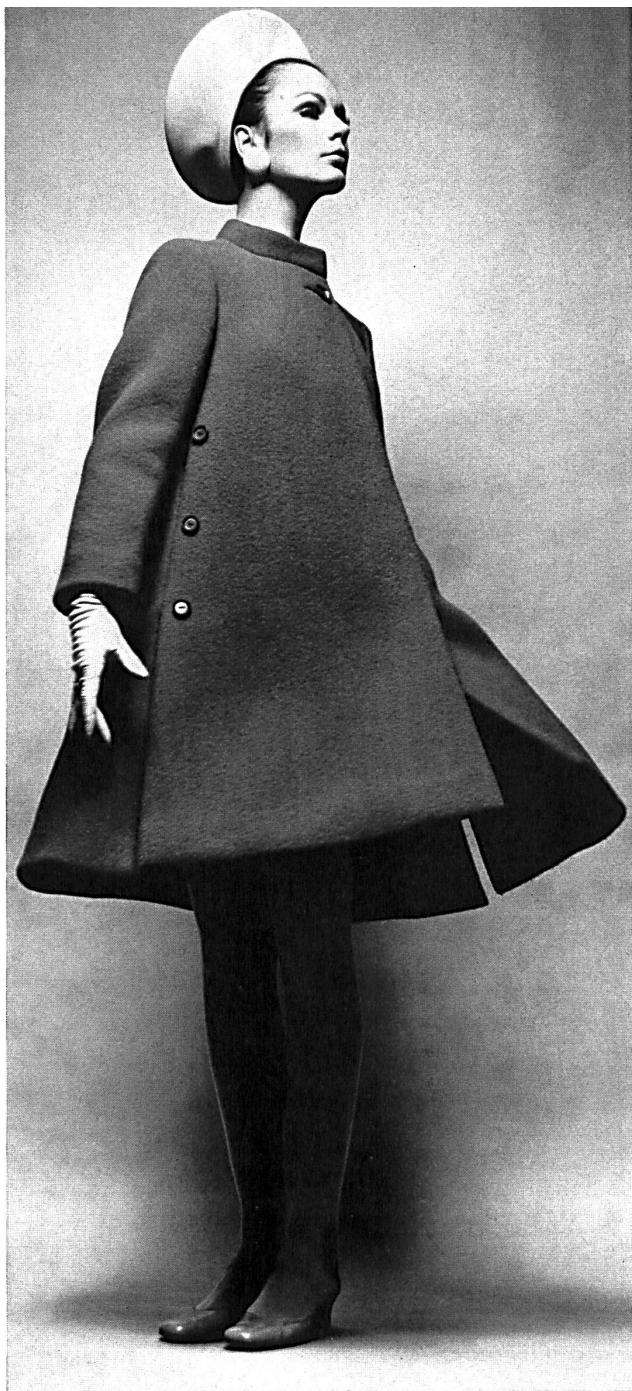
Manteau en laine Wool coat