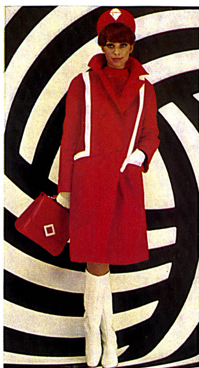
Manteau en popeline hydrofugée Water repellent cotton popeline coat