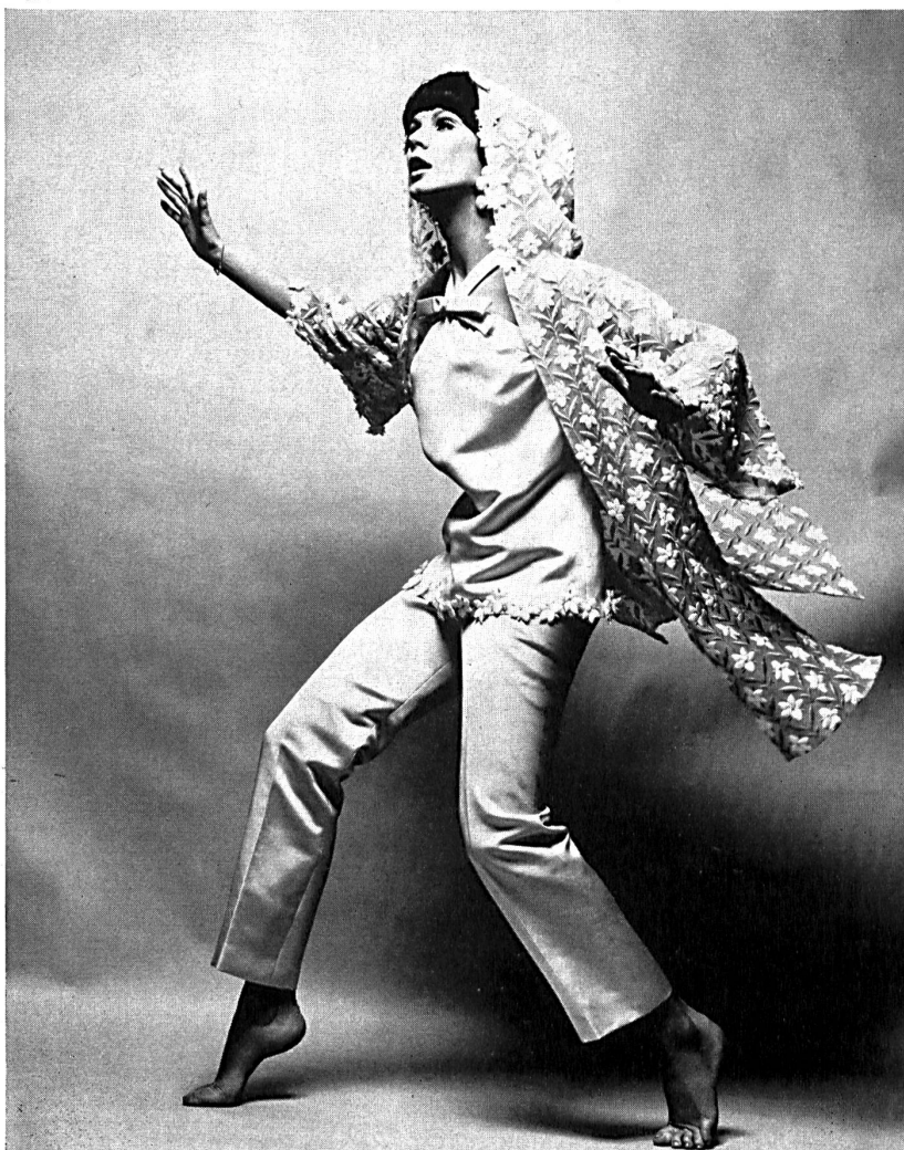
Pyjama de soie avec saut-de-lit à capuchon en broderie Silk pyjamas with embroidery wrap and hood