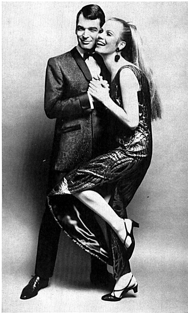
Smoking avec pantalon de Terylene ® et veste en jacquard de soie et robe du soir en tissu de lin et Lurex ® Silk jacquard dinner jacket with Terylene ® trousers, and evening dress in linen and Lurex ®

the threshold of this exhibition. In a dark nave some 20 ft. high, semi-cylindrical shapes, in aluminium and glass, hang from the ceiling like stalactites or huge floating organ pipes from which flow streams of costly materials brilliantly lit by vertical spotlights and cascading down onto large square display areas arranged in tiers. Embroidery allovers and braids, iridescent plain fabrics, lovely printed or colour woven materials mingle on the display areas — painted in matching colours and framed with metallic surrounds — with the loveliest creations of