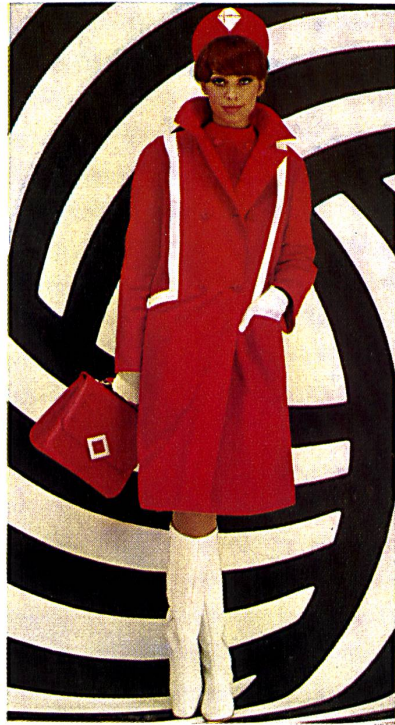
Manteau en popeline hydrofugée Water repellent cotton popeline coat