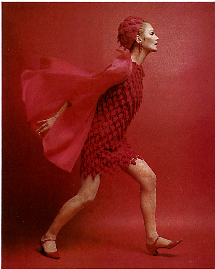
Manteau du soir en organza et robe de cocktail en guipure sur organza Evening coat in organza and cocktail dress in guipure on organza

bordure métallisée, aux produits les plus séducteurs de l'industrie suisse du vêtement: ensembles, robes de cocktail et du soir, tenues de plage et de bain, charmantes pièces de lingerie, chapeaux et chaussures. Dans la mystérieuse pénombre de la nef, ces groupes forment ensemble une riche symphonie de couleurs et de matières. Les précieux objets exposés constituent en eux-mêmes un appel visuel et se passent de tout commentaire. Toute la décoration est au service d'une seule