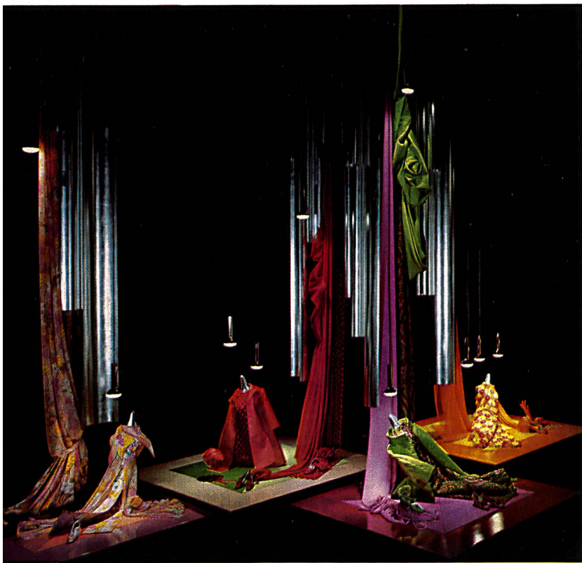
Vue générale de la section des textiles General view of the textil section

This brief survey of Switzerland's contribution would be incomplete if we did not also