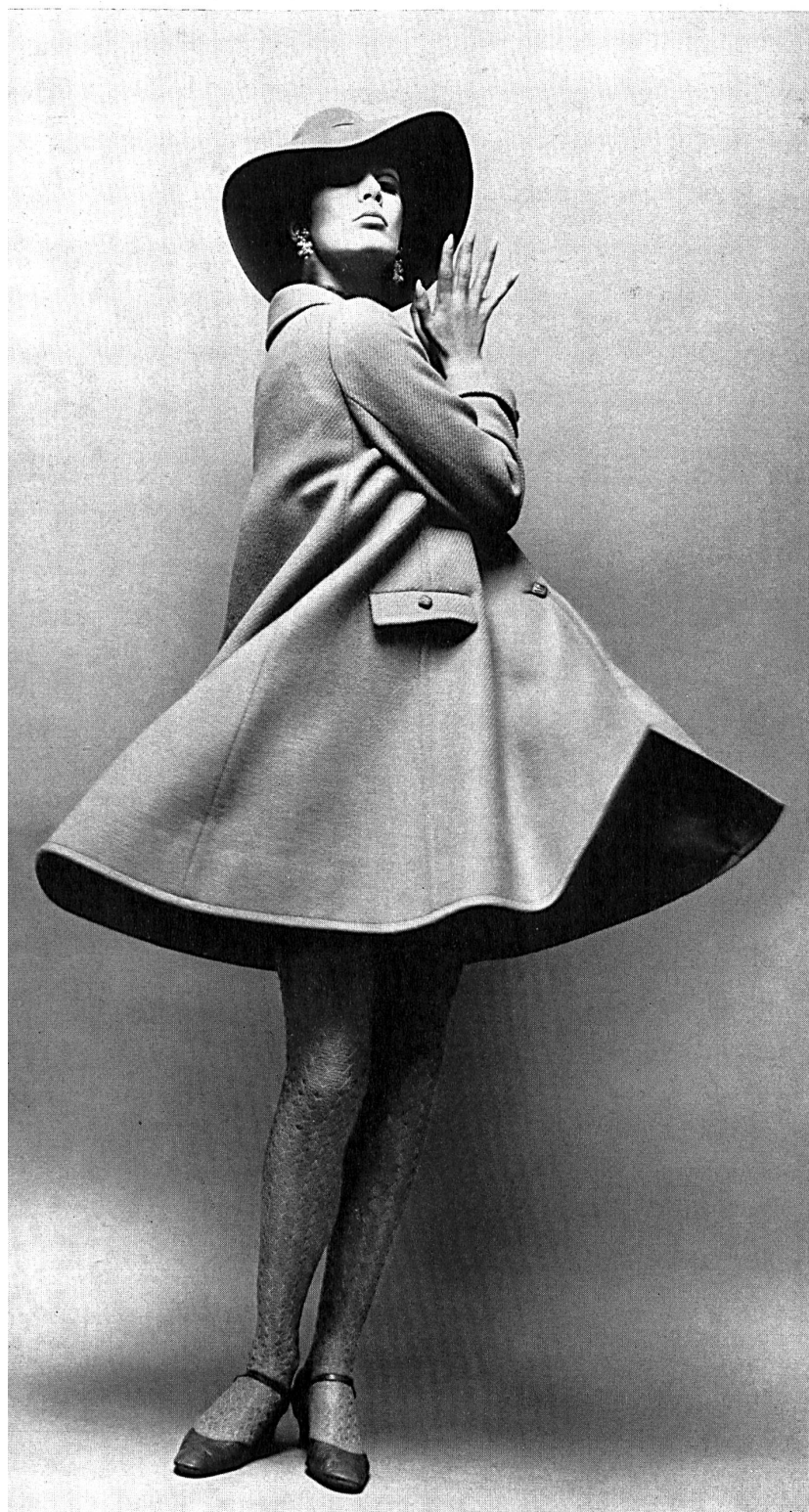
Manteau en pure laine Pure wool coat