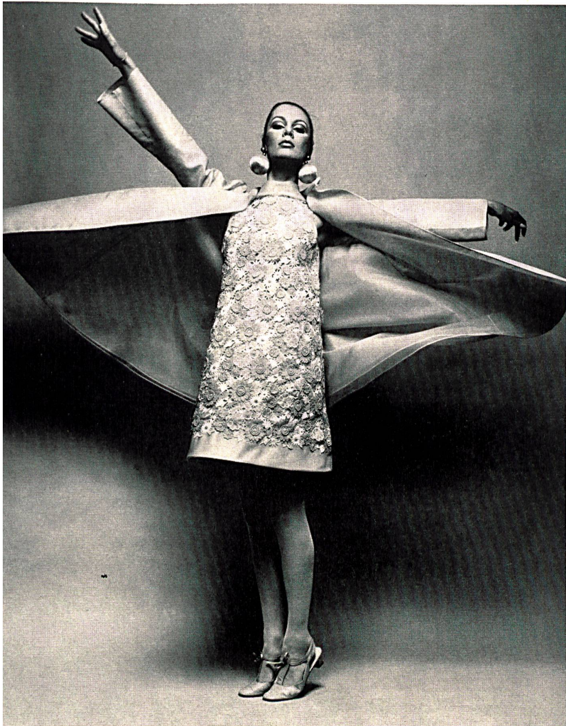
Robe de cocktail en broderie découpée avec applications de guipure et manteau de soie Basra Cocktail dress in cut-out embroidery with guipure applications and Basra silk coat

L'Orchestre de la Suisse romande et le Collegium musicum de Zurich donneront, avec le concours de solistes suisses, plusieurs concerts au cours desquels seront exécutées des œuvres de compositeurs suisses. D'autres solistes helvétiques de grand renom se produiront au cours de deux concerts de musique de chambre. Enfin, à l'occasion de la fête nationale suisse auront lieu, le 1 er août, d'importantes manifestations folkloriques à la salle de l'Expo-Théâtre.