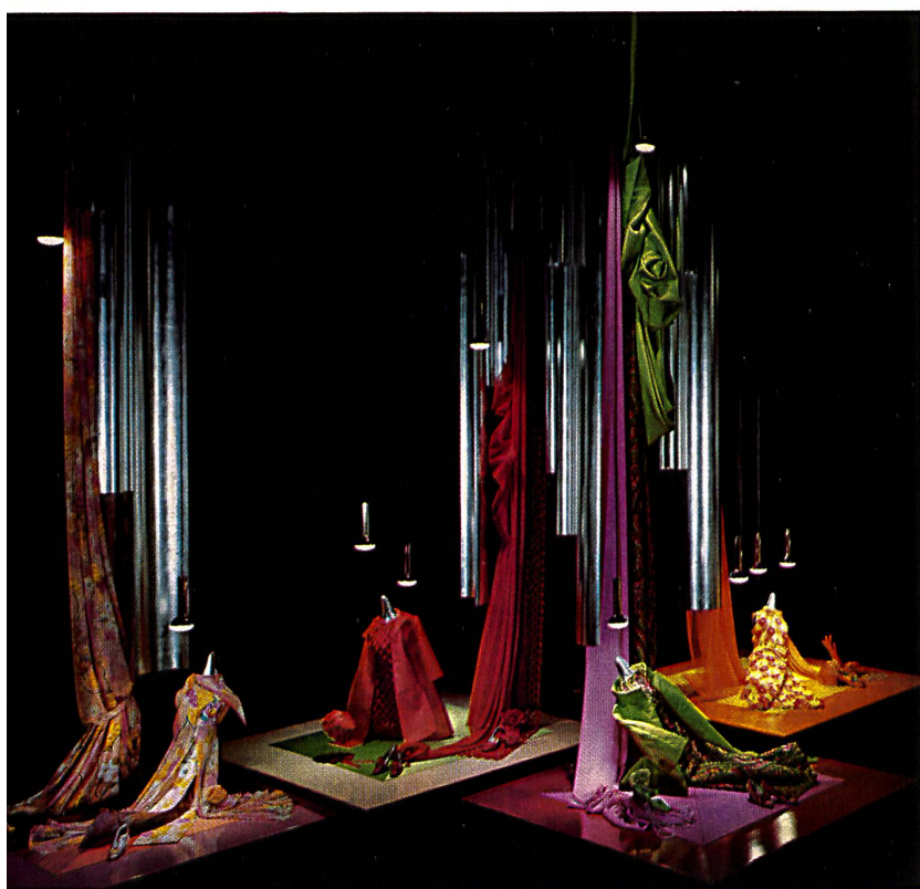
Vue générale de la section des textiles General view of the textil section

mention the main artistic events. As regards the theatre, two French-speaking companies merged in one will give six performances in French of Max Frisch's «The Chinese Wall». The « Orchestre de la Suisse Romande » and the « Collegium Musicum » of Zurich, accompanied by Swiss soloists, will give a number of concerts featuring works by Swiss composers. Other famous Swiss soloists will also be heard at two concerts of chamber music.