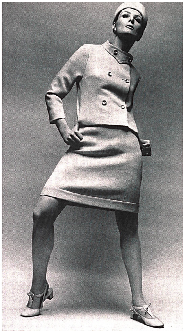
Costume d'après-midi en tissu de peigné Afternoon suit in worsted fabric