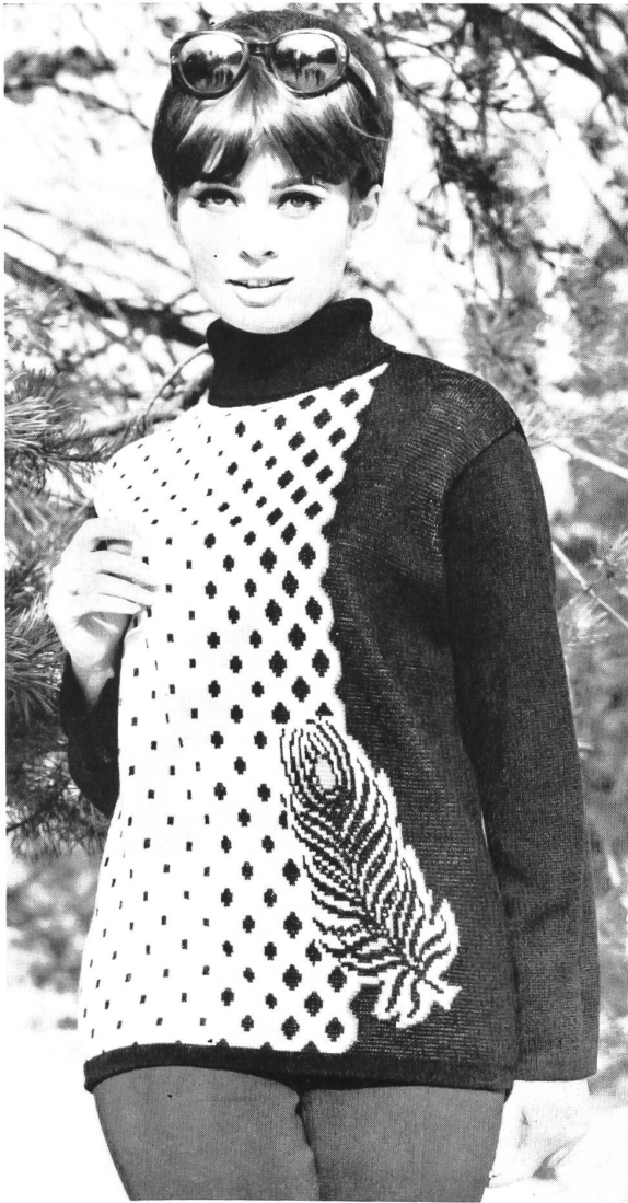
Modische Sportpullover für Damen und Herren Crimplene Deux-pièces