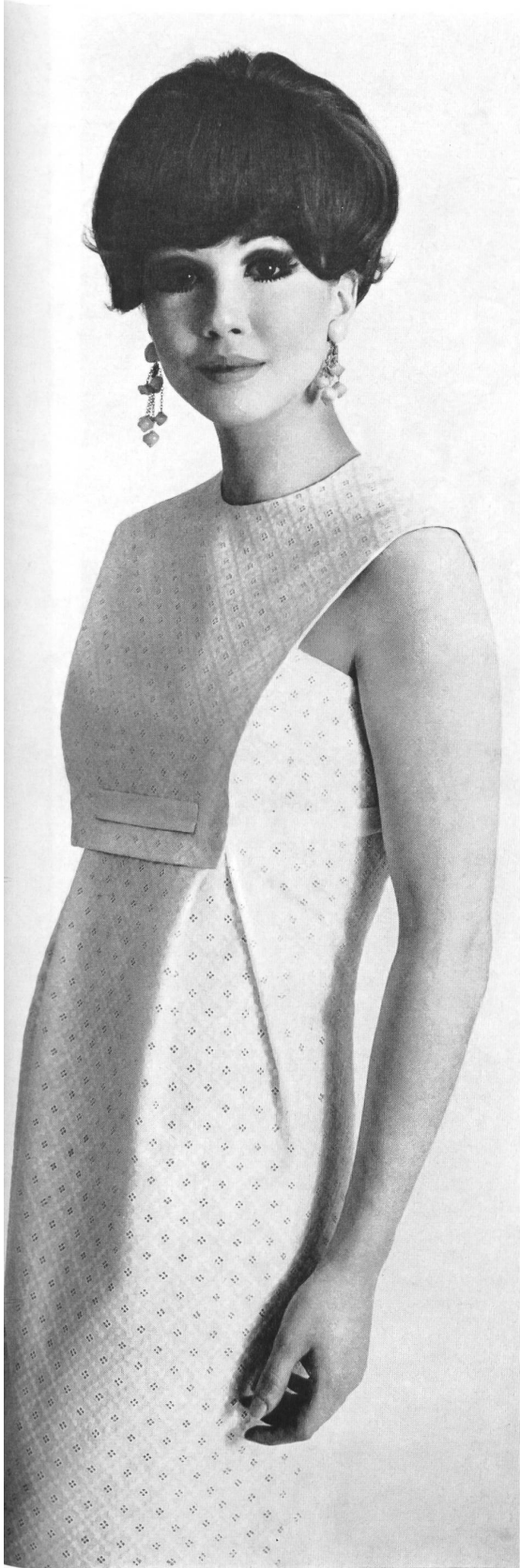
Joseph Bancroft & Sons Co Ltd, Zurich Swiss Minicare Embroidery