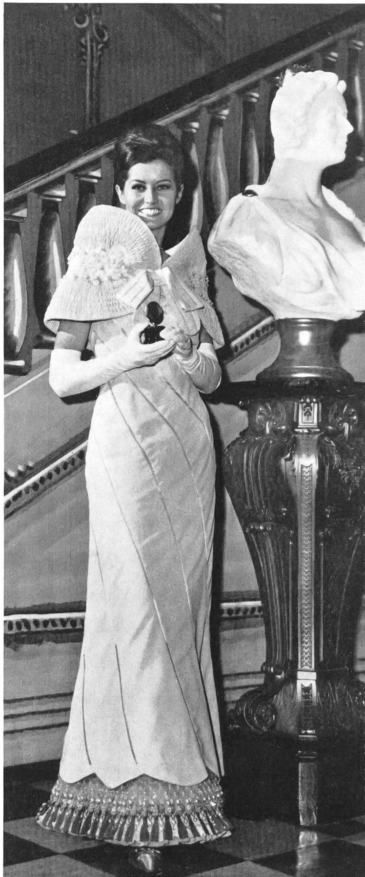
Forster Willy & Co., St-Gall Guipure Lace Fringe