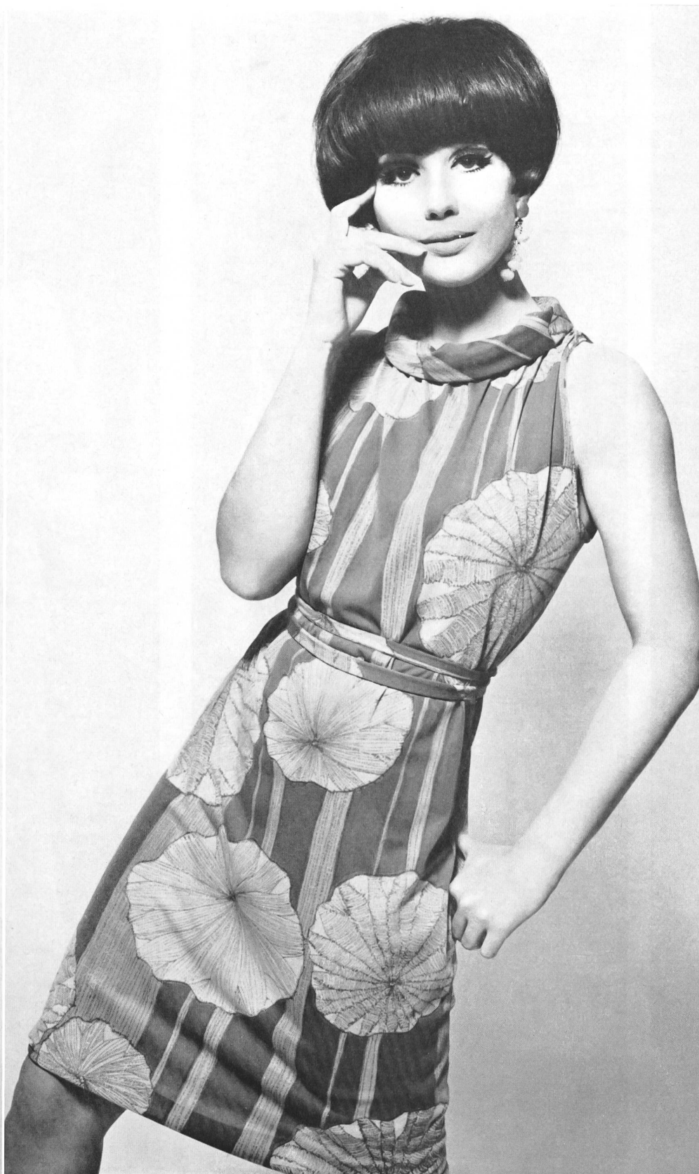
Joseph Bancroft & Sons Co Ltd, Zurich Ban-Lon Mousseline