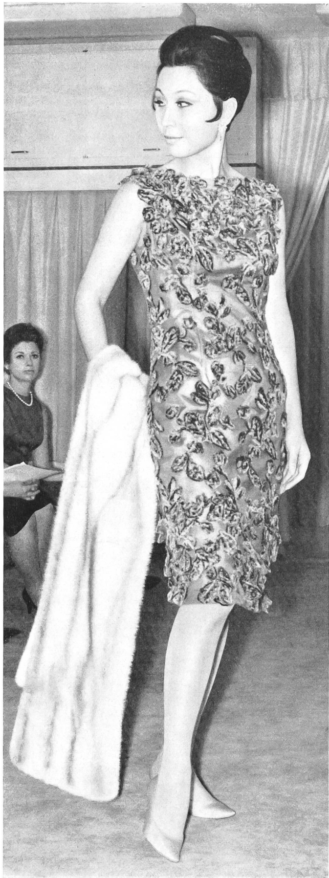
Forster Willi & Co., St-Gall Chenille Embroidery on Nylon Net