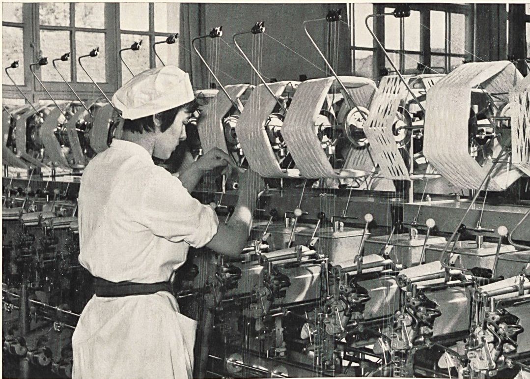
Embobinado del hilo « Helanca »®