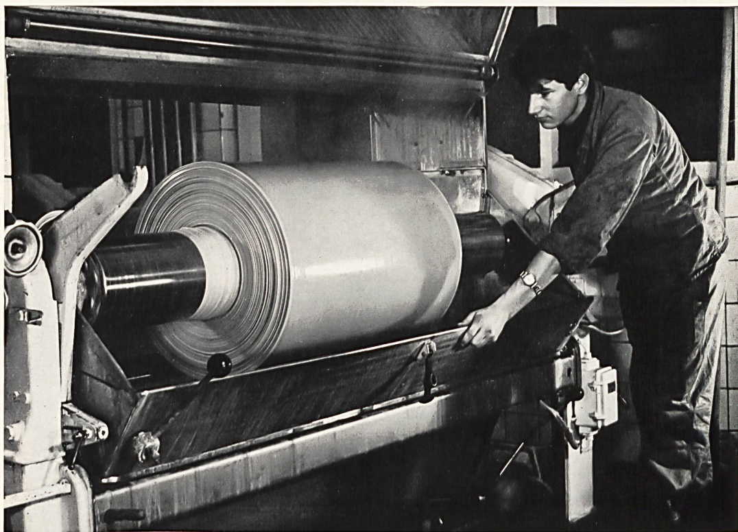
Teñido en pieza en un jigger automático

Más adelante, el taller mecánico de Heberlein AG, que estaba al principio encargado de la reparación de las máquinas y construía modelos originales destinados al tratamiento de los textiles, se dedicó al problema de la producción del «Helanca» y creó unas máquinas de las