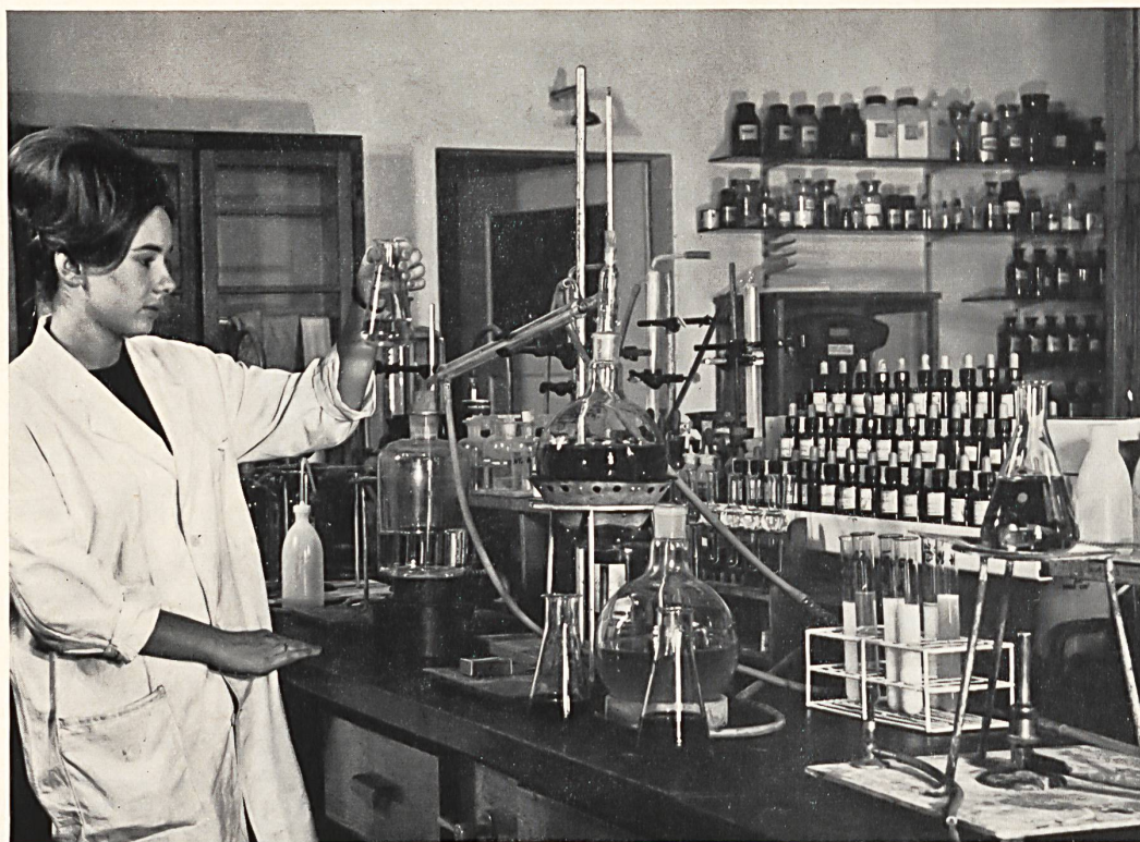
En el laboratorio de investigación

ahora preferentemente con la máquina de falsa torsión que tiene un huso que gira a la increíble velocidad hasta de 400.000 rev. p. min., retuerce las fibrilas del hilo en un sentido, las fija por el calor y las destuerce después. El hilo texturizado «Helanca», fabricado con fibras de poliamida y de poliéster, se ha introducido admirablemente bien en la moda actual y se le emplea solo o combinado con otras fibras, para telas de tricot o para tejidos, en la fabricación de bañadores, de artículos de calcetería, medias, calcetines, tricots para deporte, pulóveres, chaquetas, pantalones y blusones para esquiar, pero también