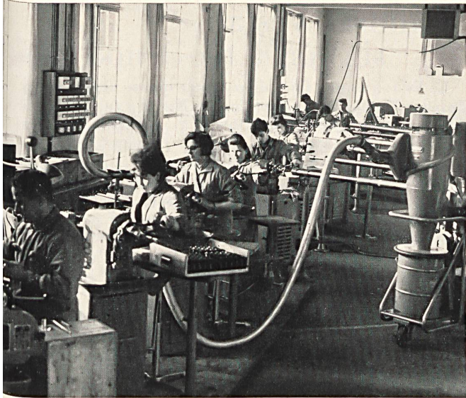
Producción de los husos magnéticos Heberlein

para vestidos elegantes, sin hablar, claro es, de la lencería.