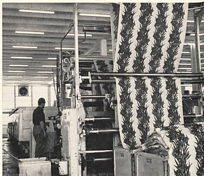
El tejido entra en la máquina de aprestar

Los hilados «Helanca», de los que ya hemos hablado antes, son los que han constituido el mayor éxito mundial de Heberlein; a fines de diciembre de 1964 existían 131 empresas que fabricaban «Helanca» con licencia de fabricación, en 26 países. Este hilo texturizado se fabrica