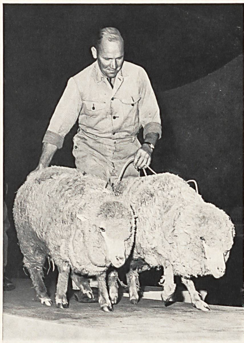
Presentación de dos ovejas merinas australianas