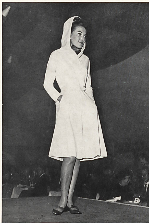
Las manequés que presentaban vestidos para la ciudad y el deporte, de lana pura de vellón, traían todas calzadas esmeradamente escogido de la famosa marca Bally