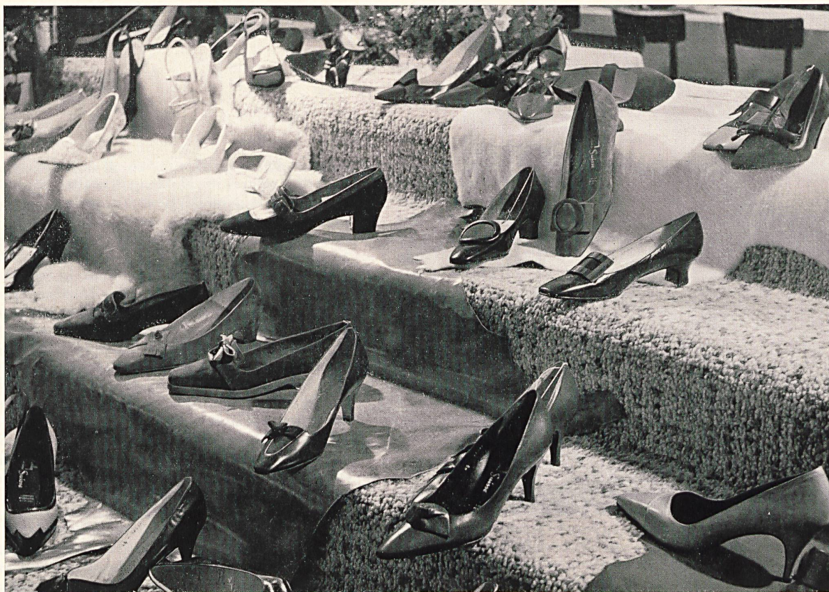
Modèles BALLY déposés

Vista parcial de la rica exposición de calzados Bally presentada a los participantes en un ambiente « lanudo »