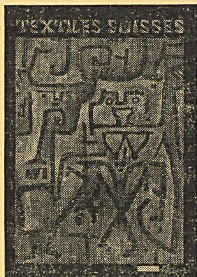
NUESTRA PORTADA Véase página 117