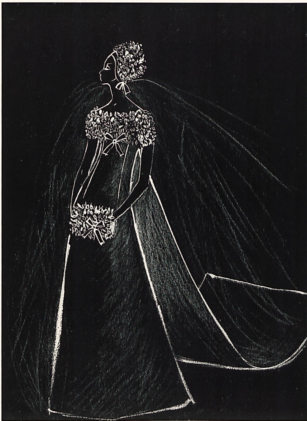
Robe de mariée en organza ivoire, avec guipure de: Bridal gown in ivory organza with guipure lace by: