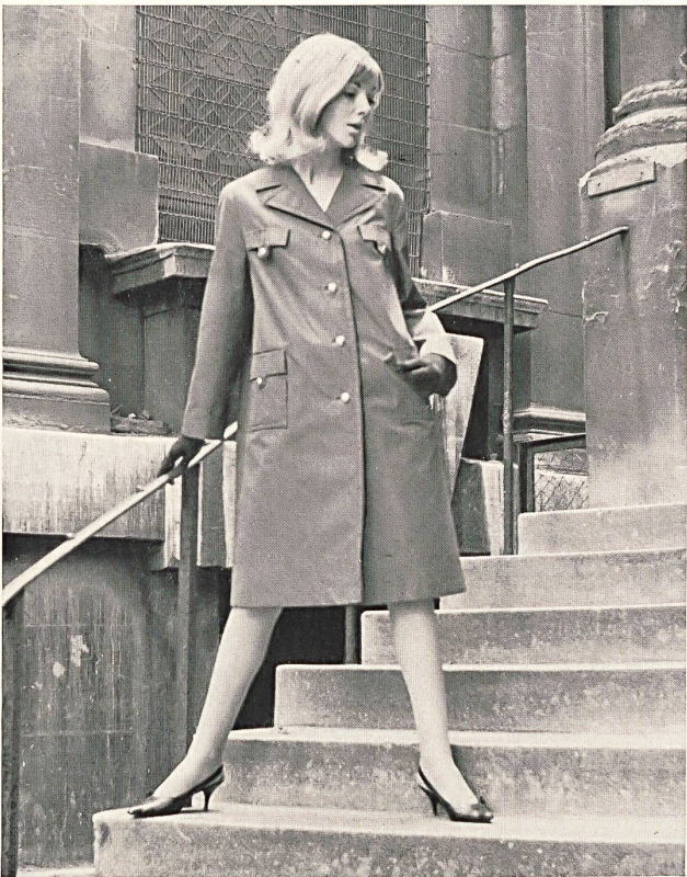
1 STOFFEL LTD., SAINT-GALL Tissu Aquaperl à finissage hydrofuge et antitaches Scotchgard Aquaperl fabric with Scotchgard rain and stain repeller finish Modèle: Morcosia