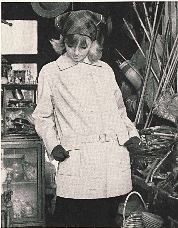
3 STOFFEL LTD., SAINT-GALL Tissu Aquaperl à finissage hydrofuge et antitaches Scotchgard Aquaperl fabric with Scotchgard rain and stain repeller finish Modèles: (à gauche / left) Heptex Ltd., Leeds (à droite / right) Cotsmoor Ltd., London