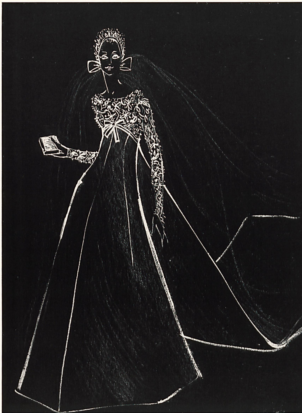
Magnifique robe de mariée; haut et manches avec applications de broderies de: Superb wedding gown; top and sleeves with superimposed applications of lace by: FORSTER WILLI & CO., SAINT-GALL Rahvis, London

segunda colección de modas, una serie especial de conjuntos elegantes y útiles que sólo requieren que se los pruebe una vez antes de ser entregados al cabo de una semana después de encargados. Su Pequeño Salón está, como de costumbre, muy bien surtido para el otoño en trajes de tonos vivos que desafían a la lluvia, y elegantes vestiditos de cóctel y de comida.