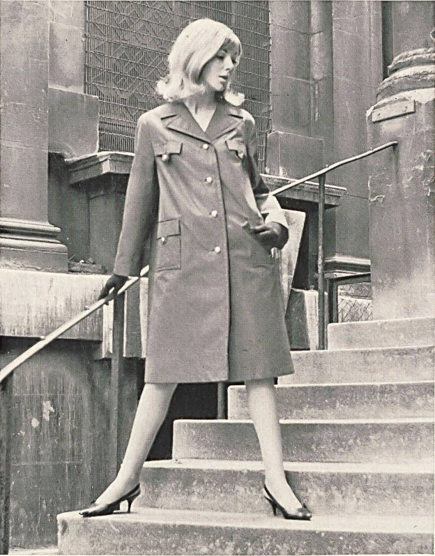
1 STOFFEL LTD., SAINT-GALL Tissu Aquaperl à finissage hydrofuge et antitaches Scotchgard Aquaperl fabric with Scotchgard rain and stain repeller finish Modèle: Morcosia