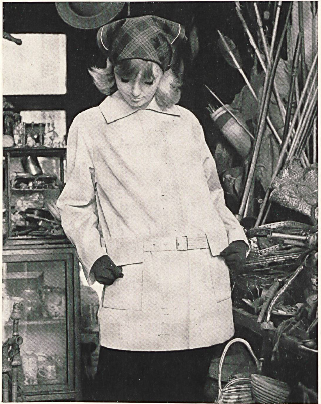
3 STOFFEL LTD., SAINT-GALL Tissu Aquaperl à finissage hydrofuge et antitaches Scotchgard Aquaperl fabric with Scotchgard rain and stain repeller finish Modèles: (à gauche / left) Heptex Ltd., Leeds (à droite / right) Cotsmoor Ltd., London