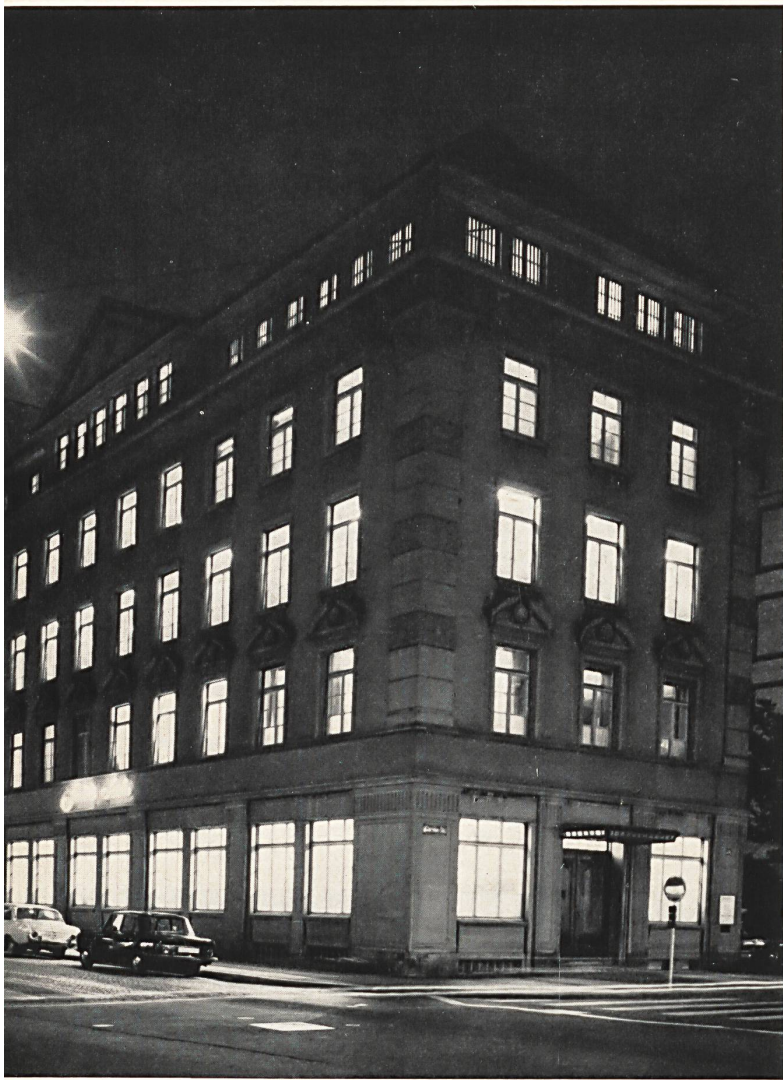
Sucursal en Zurich

para seda, y la Casa Stehli instaló sus primeros 24 telares movidos por una máquina de vapor de 10 CV. La mecanización fue progresando constantemente y suplantó rápidamente el antiguo sistema de tejeduría a domicilio. Al lado de los nuevos telares, fueron instalados algunos años después, en 1879, los telares jacquard.